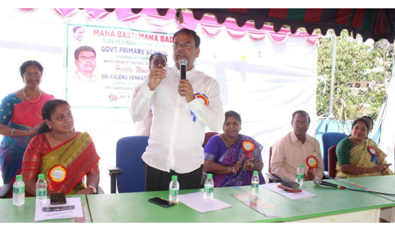
ఈ సందర్భంగా ఎమ్మెల్యే గారు మాట్లాడుతూ, గౌరవ సీ ఎం శ్రీ కేసీఆర్ గారు రాష్ట్రాన్ని బంగారు తెలంగాణగా మార్చే క్రమంలో విద్యకు అత్యధిక ప్రాధాన్యత ఇస్తున్నారని, ఇందుకోసం “మన బస్టి-మన బడి” ద్వారా వేల కోట్ల నిధులతో ప్రభుత్వ పాఠశాలలకు మహారథ తీసుకువస్తున్నట్లు చెప్పారు. ఇందులో భాగంగానే గంగా నగర్, ప్రభుత్వ ప్రాథమిక పాఠశాలలో తాగునీటి వసతి, టాయిలెట్ల సౌకర్యం, విద్యుత్ సరఫరాతో పాటు విద్యార్థులకు కూర్చోడానికి బెంచీలు, టెబుల్స్ వంటి సౌకర్యాలతో పాటుగా, తరగతి గదులను సుందరంగా తీర్చిదిద్ది, భవనానికి రంగులు వేసి ముస్తాబు చేయడమే కాకుండా పిల్లలు ఆడుకోవడానికి క్రీడా పరికరాలు ఏర్పాటు చేయడంతో పాటుగా విరివిగా మొక్కలు పెంచి పాఠశాలలో ఆహారాన్ని సృష్టించడం జరిగిందని ఆయన వివరించారు. అంబర్ పేట నియోజక వర్గంలో మరిన్ని పాఠశాలల్లో మెరుగైన వసతులు కల్పించి ప్రైవేటుకు ధీటుగా సిద్ధం చేయనున్నామని ఆయన తెలిపారు. నాణ్యమైన విద్యతో పాటుగా ఆహారాన్ని అందించడంలో పిల్లలు చదువుకొని మరింతగా రాజీందానలన్నదే తన ఆకాంక్ష అని ఎమ్మెల్యే కాలేరు వెంకటేష్ గారు పేర్కొన్నారు.

అంబర్ పేట:- మే 17: (వాయిస్ టు డే): అంబర్ పేట నియోజకవర్గం గోల్కాకూర్ డివిజన్ లోని గంగా నగర్ ప్రభుత్వ ప్రాథమిక పాఠశాలలో “మన బస్టి - మన బడి” కార్యక్రమంలో భాగంగా 25.3 లక్షల రూపాయల నిధులతో పూర్తి చేసిన అధునికరణ పనులను ఈరోజు అంబర్ పేట ఎమ్మెల్యే శ్రీ కాలేరు వెంకటేష్ గారు ప్రారంభించారు.