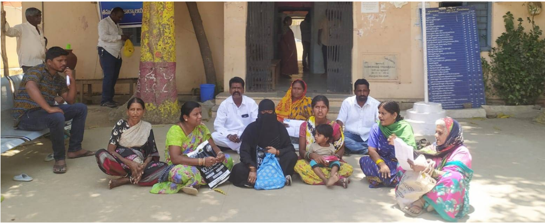
నమ్ముకున్న వారికి తీవ్ర అన్యాయం చేస్తున్న మున్సిపాలిటీ కీలక ప్రజా ప్రతినిధి.

నిజమైన అర్హులకు డబుల్ బెడ్ రూమ్ కేటాయింపు.