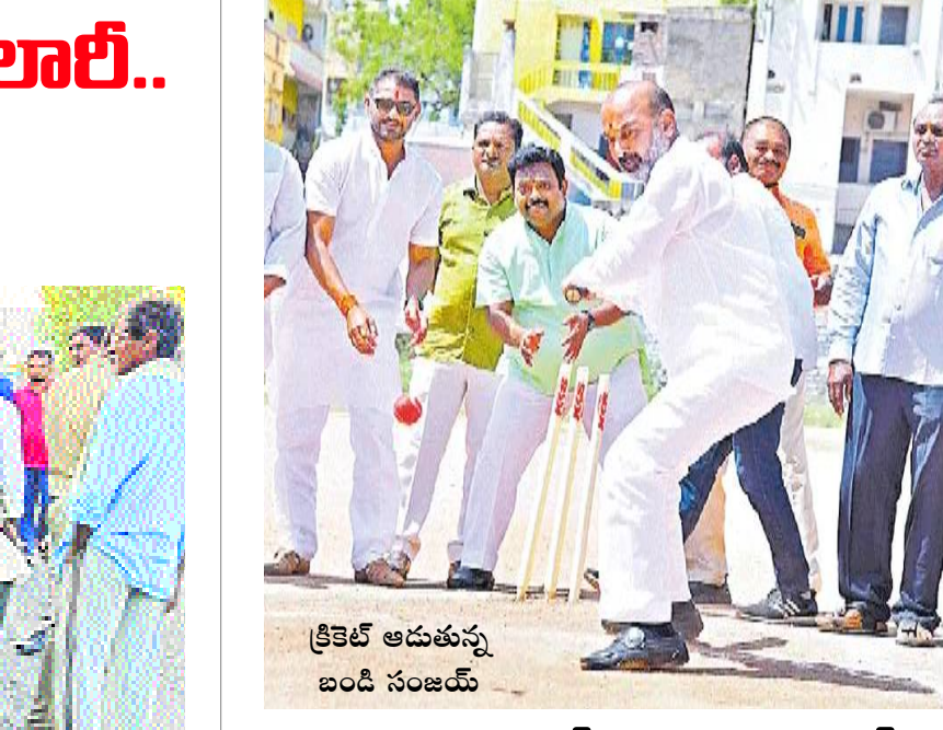
క్రికెట్ ఆడుతున్న బండి సంజయ్