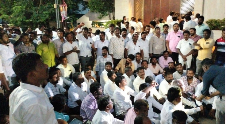
జూబ్లీహిల్స్ జూన్ 15 (వాయిస్ టుడే) : జూబ్లీహిల్స్లో నాగర్ కర్నూల్ ఎమ్మెల్యే మర్రి జనార్దన్ రెడ్డి ఇంటి ముందు ఎమ్మెల్యే మీద జరుగుతున్న బలీ దారులకు వ్యతిరేకంగా నిరసనకు దిగిన బిఆర్ఎస్ కార్యకర్తలు.