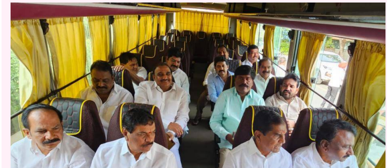
తెలంగాణ రాష్ట్ర ముఖ్యమంత్రి వర్యులు శ్రీ కేసీఆర్ గారు మహారాష్ట్ర పర్యటనలో భాగంగా పండరీపూర్, తులజాపూర్ ఆలయాల సందర్శనానికి వెళ్తున్న ఎమ్మెల్యే నన్నపనేని సరేందర్, సహచర ఎమ్మెల్యేలు మరియు ఎమ్మెల్యేలు, ఇతర ప్రజాప్రతినిధులు.