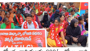
మధ్యహాన భోజన కార్మికులకు 600/- రోజు వారి చెల్లించుచున్నారు.కావున ఇక్కడ కూడ చెల్లించాలి. 7.పెన్షన్.10, 000/ చెల్లించాలి. 8.ప్రభుత్వం నిత్యావసర వస్తువులు,గానీ సెలిండర్ లు,కోడి గుడ్డు లు సరఫరా చేయాలి 9.7.26, 000/- కనీస వేతనాలు చెల్లించాలి, ప్రభుత్వ ఉద్యోగుల గుర్తింపాలి అని అన్నారు