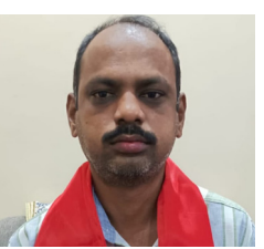
ఫిర్యాదులు చేసుకుంటున్నారని ఇంత జరుగుతున్న కమిషనర్,మేయర్ ఏమాత్రం పట్టించుకోవడంలేదని ఆందోళన వ్యక్తం చేశారు.