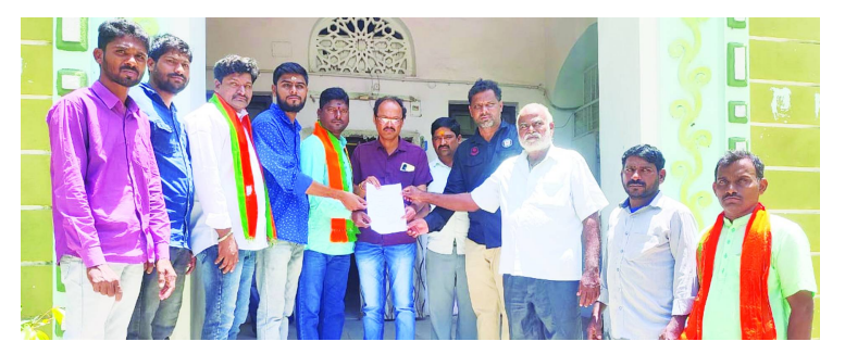
తహసీల్దార్ కు వినతిపత్రం