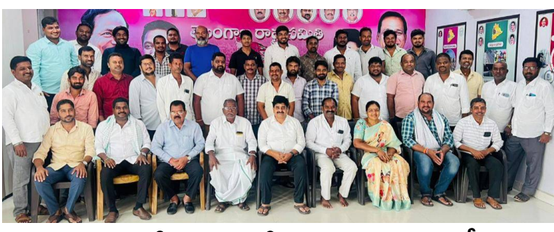
కమలానగర్లో అసోసియేషన్ నూతన కమిటీ ఎన్నిక