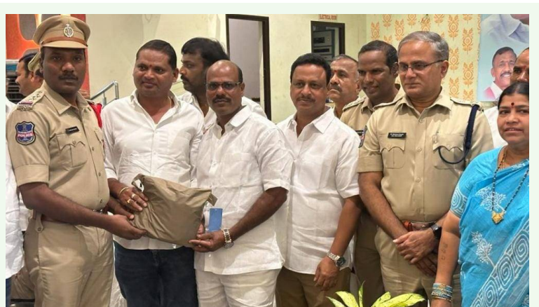
పటాన్నెరపు నియోజకవర్గ పరిధిలోని విధులు నిర్వహిస్తున్న 425 మంది పోలీసులు శాఖ సిబ్బంది పటాన్నెరు ఎమ్మెల్యే గూడెం మహిపాల్ రెడ్డి గారు 4 లక్షల రూపాయలు సొంత నిధులతో అందించిన రైస్ కోట్లను పంపిణీ చేసిన జిల్లా ఎస్పీ రమణ కుమార్. ఈ కార్యక్రమంలో పాల్గొన్న నాయకులు ప్రజాపతి పీఠులు కార్యకర్తలు - పటాన్నెరు (వాయిస్ టుడే)