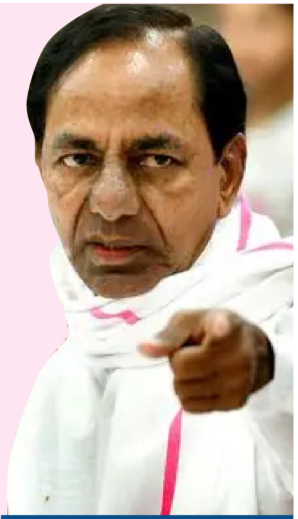
బీఆర్ఎస్ ముఖ్యనేతలు ఆలోచనలు చేస్తున్నట్లు తెలిసింది. ఏదేమైనా కాంగ్రెస్ దూకుడుకు కళ్లెం వేసి మూడో సారి అధికారాన్ని దక్కించుకోవాలని బీఆర్ఎస్ నేతలు భావిస్తున్నారు.

అంతర్గతంగా మల్లగుల్లలు పడుతున్నాయి. నిజానికి, ఆదివారం నాటి సభలో కాంగ్రెస్ ఏం ప్రకటనలు చేస్తుందని బీఆర్ఎస్ శ్రేణులు ఉడయం నుంచే అసక్తిగా ఎదురు చూశాయి. కాంగ్రెస్ హోమీలపై కొందరు నేతలు తమ అనుభూతులతో చర్చలు జరిపి ఆరాలు తీసారని తెలిసింది. అయితే, కాంగ్రెస్ హోమీలను తిప్పికొట్టేందుకు ఏం చెయ్యాలి అనే దానిపై బీఆర్ఎస్ అధినేత కేసీఆర్ కూడా కనరత్తు చేస్తున్నారని సమాచారం. కాంగ్రెస్ను మించి హోమీలు ఇదామా ? లేనివక్షంలో కాంగ్రెస్ హోమీల అమలు అసాధ్యమని ప్రజలకు చెబుదామా ?