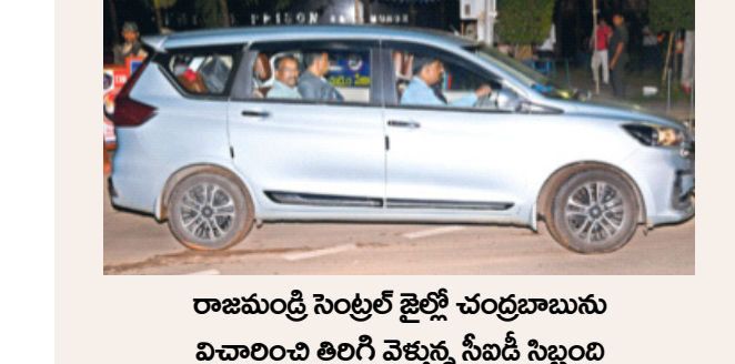
రాజమండ్రి సెంట్రల్ జైల్లో చంద్రబాబును విచారించి తిరిగి వెళ్తున్న సీబీడీ సిబ్బంది

రాజమండ్రి, సెప్టెంబర్ 23: రాజమండ్రి సెంట్రల్ జైల్లో టీడీపీ అధినేత చంద్రబాబును సీబీడీ అధికారులు కన్నడికి తీసుకున్నారు. ఉదయమే చంద్రబాబుకు ప్రత్యేక వైద్య బృందం మెడికల్ టెస్టులు చేసింది. అల్పాహారాన్ని తీసుకున్న చంద్రబాబు మెడిసిన్ తీసుకున్నారు. కోర్టు ఆదేశాల మేరకు సరిగ్గా ఉదయం 9.30 గంటలకు ఆయనను సీబీడీ అధికారులు కన్నడికి తీసుకుని, విచారణను ప్రారంభించారు. సాయంత్రం 5 గంటల వరకు విచారణ కొనసాగింది. స్కిల్ డెవలప్ మెంట్ కేసు.. చంద్రబాబు నాయుడు విచారణ 2017లో.. 15గంటలు.. 120 ప్రశ్నలు.. మొత్తం ఆధారాలతో సీబీడీ అధికారులు ప్రశ్నిస్తున్నారు. డాక్యుమెంట్స్ ముందుపెట్టి బాబుపై మోపిన మొత్తం 34 అభియోగాలపై ప్రశ్నలు సంధిస్తున్నారు సీబీడీ అధికారులు.. బాబు తరఫున ఇద్దరు లాయర్ల సమక్షంలోనే.. లోకేష్, కిలారి రాజేష్, పీపీ శ్రీనివాస్ పాత్రపై ఆరా తీస్తోంది. మధ్య మధ్యలో 5 నిమిషాలు విరామం తర్వాత.. మళ్లీ ప్రశ్నిస్తోంది. ఉదయం పదిగంటలకు మొదలైన విచారణ లంకే బ్రేక్ వరకూ కొనసాగింది. మొదటి సెషన్ లో 3 గంటలకు పైగా సీబీడీ అధికారులు విచారణ చేశారు. ప్రతి గంటలకు ఇద్దరు చొప్పున సీబీడీ అధికారులు చంద్రబాబును ప్రశ్నించారు. ఉదయం 9.30 గంటలకు రాజమండ్రి