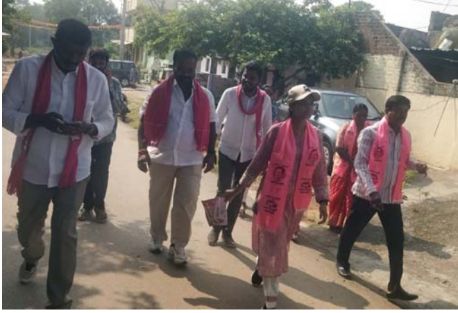
భువనగిరి ఎమ్మెల్యేగా రెండు పర్యాయాలు గెలిచి భువనగిరిని ఎంతో అభివృద్ధి చేసి, ఆదర్శవంత నియోజకవర్గంగా తీర్చిదిద్దిన ఘనత ఆయనకే దక్కింది అన్నారు. తెలంగాణ రాష్ట్ర ప్రభుత్వ సంక్షేమ పథకాలను అన్ని వర్గాల ప్రజలకు అందజేసారని, అదే క్రమంలో