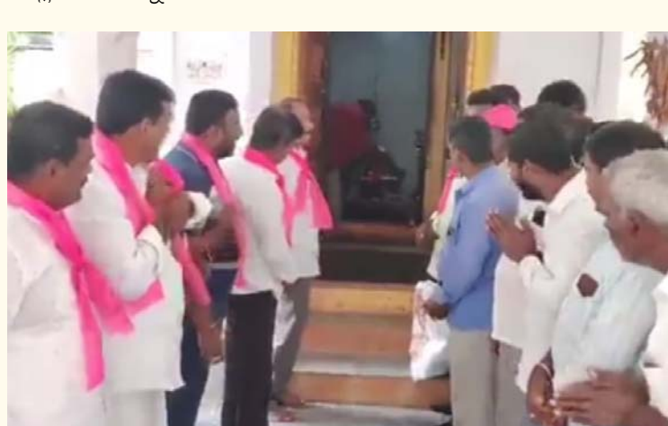
అశ్వాపూర్, అక్టోబర్ 31: (వాయిస్ టుడే) భద్రాద్రి కొత్తగూడెం జిల్లా అశ్వాపూర్ మండలం మొండికుంట గ్రామంలో మంగళవారం అంగన్వాడీ టీచర్స్, హెల్పర్స్ అసోసియేషన్ ఆధ్వర్యంలో ఏబిటియూసీ 104 వ ఆవిర్భావ దినోత్సవ వేడుకలను ఘనంగా నిర్వహించారు.

దుబ్బాక (వాయిస్ టుడే ప్రతినిధి) అక్టోబర్ 31, సిద్దిపేట జిల్లా దుబ్బాక పట్టణ కేంద్రంలో హనుమాన్ దేవాలయంలో జాను మసీదు పలు చోట్ల కత్తిపోట్లతో గాయపడిన ఎంపీ కొత్త ప్రభాకర్ రెడ్డి త్వరగా కోలుకోవాలని ప్రత్యేక పూజ ప్రార్థన కార్యక్రమాలు నిర్వహించారు ఈ సందర్భంగా వారు మాట్లాడుతూ ఎన్నికల ప్రచారంలో భాగంగా దొల్తాబాద్ మండలం సూరంపల్లి గ్రామంలో ప్రచారం చేస్తున్న ఎంపీ కొత్త ప్రభాకర్ రెడ్డి పై కత్తి దాడి చేయడం ధ్యేయమైన చర్య అన్నారు చీమడి కూడా హాని తగలకుండా అహర్వలు నియోజకవర్గం అభివృద్ధి కోసం పాటుపడిన ఎంపీపై ఇలాంటి దాడులు సోషలియమన్నారు ఎంపీ కొత్త ప్రభాకర్ రెడ్డి శివుని అల్లా యేను దీవెన లతో త్వరగా కోలుకోవాలని ప్రార్థిస్తున్నట్లు బిఆర్ఎస్ నాయకులు ఆ దేవుళ్లను కోరుకున్నారు.