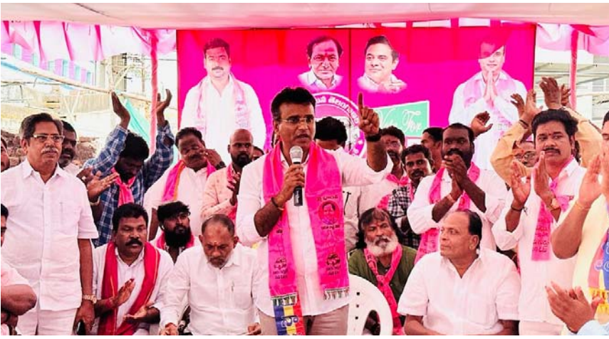
250 యూనిట్ల ఉచిత విద్యుత్, పన్ను మినహా యింపు చేసిన ఏకైక ప్రభుత్వం బిఆర్ఎస్ యేనన్నారు. అంతేకాక బీసీ బంధు ద్వారా ఒక్కొక్కరికి లక్ష రూపాయల ఆర్థిక సహాయాన్ని అందించి వారిని ప్రోత్సహించిన