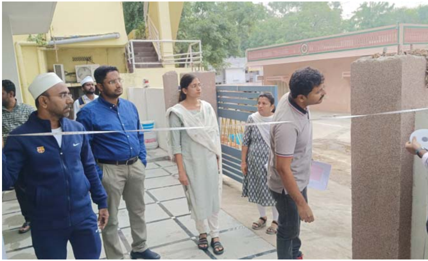
నిర్మించిన సి సి రోడ్ పనులు, నంది హిల్స్ సమీపంలో డ్రైన్, గోకుల్ నగర్ ప్రాంతం లో సమీపంలో కల్వర్టు, డ్రైన్ పనులు, శ్యామల పేట నాతనం గా నిర్మించిన కమ్యూనిటీ హాల్ లను పరిశీలించి అగ్రిమెంట్ లో పేర్కొన్న నిబంధనల