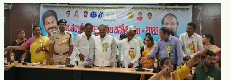
వికలాంగుల సంక్షేమ శాఖకు వికలాంగుడినే మంత్రిగా నియమించేలా ముఖ్యమంత్రి రేవంత్ రెడ్డి ప్రభుత్వం కృషి చేయాలి