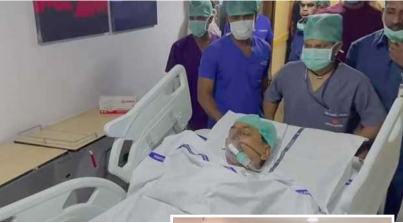
సర్జరీ అనంతరం యశోద ఆసుపత్రి వైద్యులు తెలిపారు.