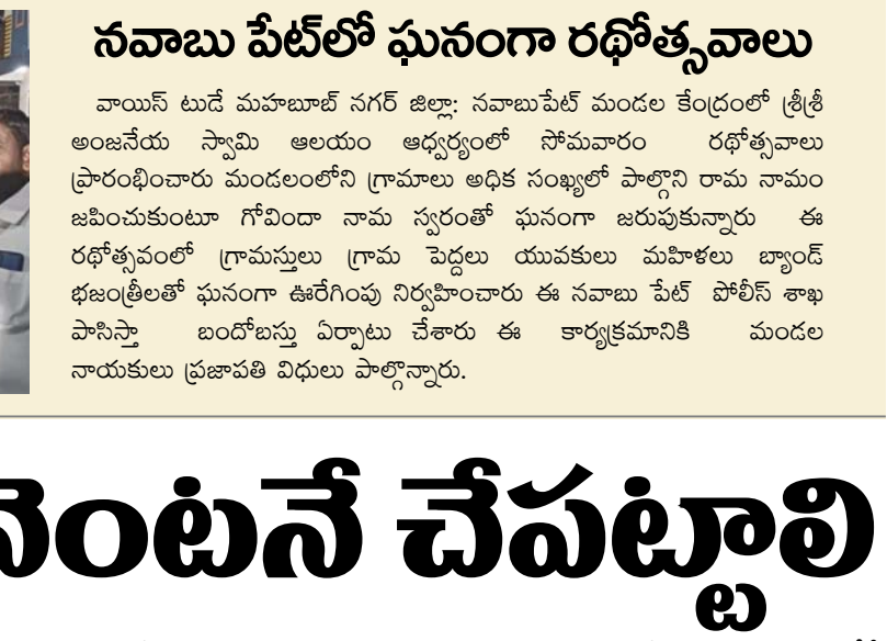
బీసీ కుల గణన వెంటనే చేపట్టాలి

వాయిస్ టుడే మహబూబ్ నగర్ జిల్లా: నవాబుపేట్ మండలం కేంద్రంలో శ్రీశ్రీ అంజనేయ స్వామి ఆలయం ఆధ్వర్యంలో సోమవారం రథోత్సవాలు ప్రారంభించారు మండలంలోని గ్రామాల అధిక సంఖ్యలో పాల్గొని రామ నామం జపించుకుంటూ గోవిందా నామ స్మరంతో ఘనంగా జరుపుకున్నారు ఈ రథోత్సవంలో గ్రామస్తులు గ్రామ స్పర్ధలు యువకులు మహిళలు బ్యాండ్ భజనంతో ఘనంగా ఊరేగింపు నిర్వహించారు ఈ నవాబు పేట్ పోలీస్ శాఖ పాసిస్తా బందోబస్తు ఏర్పాటు చేశారు ఈ కార్యక్రమానికి మండల నాయకులు ప్రజాపతి విధులు పాల్గొన్నారు.