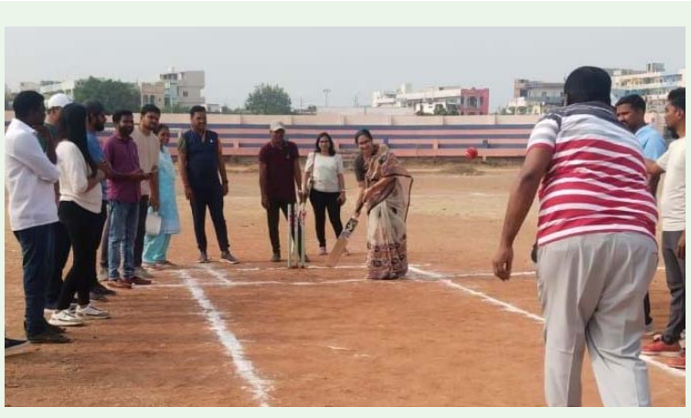
జస్టిస్ కొమరయ్య లా విద్యార్థులకు క్రికెట్ పోటీలు

విద్యార్థుల మానసిక ఉల్లాసానికి క్రీడలు అవసరం