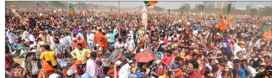
ప్రణాళికలను బీజేపీ రూపొందించింది.

వ్యతిరేక ప్రచారం చేసేందుకు.. ఆరు గ్యారంటీలు, వాటి అమలుకు సంబంధించి రాష్ట్ర ప్రభుత్వపరంగా, కాంగ్రెస్ పార్టీపరంగా చేసిన ప్రకటనలనే బీజేపీ వినియోగించుకుంటోంది. కాంగ్రెస్ పార్టీ డిక్షరీషన్లు, గ్యారంటీలు పేరిట తెలంగాణ ప్రజలను మోసం చేస్తోందంటూ.. ప్రత్యేకంగా ‘ప్రశ్నిస్తున్న తెలంగాణ..’ పేరిట ఎన్నికల ప్రచార కార్యక్రమాన్ని ఇటీవలే ప్రారంభించింది. మహిళలు, విద్యార్థులు, యువత, రైతులు, వ్యవసాయ కూలీలు.. ఇలా వివిధ వర్గాలకు ఇచ్చిన హామీలైన పింఛన్ పెంపు, గౌరెల పంపిణీ, నిరుద్యోగ భృతి వంటి హామీల అమలు తీరును ప్రశ్నిస్తోంది. కాంగ్రెస్ గ్యారంటీల అమలు కోసం ఒత్తిడి చేస్తూ.. ఆయా పథకాల కింద లబ్ధి ఆశిస్తున్న వారిని సమీకరిస్తోంది. వారి ద్వారా ప్రభుత్వాన్ని ప్రశ్నించేలా కార్యాచరణను అమలు చేయాలని నిర్ణయించింది. కేంద్ర మంత్రి, బీజేపీ రాష్ట్ర అధ్యక్షుడు జి.కిషన్ రెడ్డి, బీజేపీ పార్లమెంటరీ బోర్డు సభ్యుడు కె.లక్ష్మణ్ ఆధ్వర్యంలో ఇప్పటికే ‘ప్రశ్నిస్తున్న తెలంగాణ’ కార్యక్రమాన్ని ప్రారంభించారు. దీనికి కొనసాగింపుగా ‘ప్రశ్నిస్తున్న రైతు..’ కార్యక్రమాన్ని కె.లక్ష్మణ్, బీజేపీ జాతీయ కార్యవర్గసభ్యుడు, మల్లాజిగిరి ఎంపీ అభ్యర్థి ఈటల రాజేందర్ మొదలుపెట్టారు. ఈ క్రమంలోనే ‘ప్రశ్నిస్తున్న మహిళ..’ ప్రశ్నిస్తున్న నిరుద్యోగి.. ప్రశ్నిస్తున్న వ్యవసాయ కూలీ..’ అంటూ కాంగ్రెస్ డిక్షరీషన్లు, గ్యారంటీలు, మేనిఫెస్టోలో పొందుపరిచిన అంశాలను ఎత్తిచూపేలా