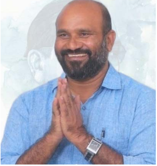
ఖమ్మం, పరిగి లో రెగ్యులర్ స్టూడెంట్ల భర్తీ చేయనున్నారని తెలంగాణ గురుకులాల పేరెంట్స్ అసోసియేషన్ (డి జి పి

వాయిస్ టుడే - జమ్మికుంట: తెలంగాణ ఎస్సీ ఎమ్మెల్యే గురుకులాల్లో 6,7,8,9 తరగతులలో దరఖాస్తులు చేసుకోండి. గత నెల 29న తెలంగాణ రాష్ట్ర సాంఘిక సంక్షేమ మరియు గిరిజన సంక్షేమ విద్యాలయంలో జనరల్ గురుకులాల్లో 6,7,8,9 వ తరగతి వరకు ఖాళీలుగా మిగిలిన ఉన్న స్థల భర్తీ కోసం నోటిఫికేషన్ విడుదల చేయగా అడ్మి చేశారుని తెలిపారు. సాంఘిక సంక్షేమ గురుకులాల విద్యా సంస్థలు సెంటర్ ఆఫ్ ఎక్స్ లెన్స్ (సి ఓ ఐ) 2024-25 విద్యా సంవత్సరం కోసం 8 వ తరగతి పూర్తి చేసుకొని 9 వ తరగతి ప్రవేశం కోసం తెలంగాణ రాష్ట్రంలోని రంగారెడ్డి జిల్లా గౌరీపేట సెంటర్ ఆఫ్ ఎక్స్ లెన్స్ (సి ఓ ఐ) లలో విద్యార్థినిలకు 80 స్థానాలు, విద్యార్థులకు 80 స్థానాలు, కరీంనగర్ జిల్లా అలుగుసూర్ సెంటర్ ఆఫ్ ఎక్స్ లెన్స్ (సి ఓ ఐ) లలో విద్యార్థినిలకు 80 స్థానాలు, విద్యార్థులకు 80 స్థానాలు భర్తీ చేయనున్నారని, గిరిజన సంక్షేమ గురుకులాల్లో (ఎస్ ఓ ఐ) VIII తరగతి లో