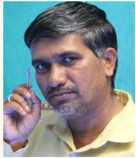
అనపురం రమేశ్, ఎంపి ఇది నా స్వీయ రచన. - సైదాపూర్ (వాయిస్ టుడే)