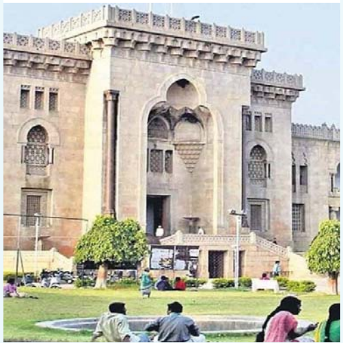
మంచి అసోసియేషన్ కావాలని, కొంతమంది వద్దని చెబుతున్నారని వీసీ వారితో చెప్పారని పేర్కొన్నారు. అసోసియేషన్ సమావేశం ఏర్పాటు చేసి, ఏకగ్రీవం

సికింద్రాబాద్, ఏప్రిల్ 19 (వాయిస్ టుడే ప్రతినది): ఉస్మానియా యూనివర్సిటీ గెజిటెడ్ ఆఫీసర్స్ అసోసియేషన్ ఎన్నికలు తక్షణమే నిర్వహించాలని పలువురు అధికారులు డిమాండ్ చేశారు. ప్రస్తుత వీసీ ప్రొఫెసర్ రవీందర్ గత మూడేళ్లగా అసోసియేషన్ను పూర్తిగా నిర్వీర్యం చేసి, అసోసియేషన్ లేకుండా చేశారని ఆరోపించారు. 2022 సంవత్సరం నుంచి ఓయూ డైరీలో సైతం అసోసియేషన్ సభ్యుల పేర్లు తొలగించారని గుర్తు చేశారు. దీనిపై ఉన్నతాధికారులకు వినతిపత్రం అందజేయమని చెప్పారు. అసోసియేషన్ ఉనికి లేకుండా చేశారని ఆవేదన వ్యక్తం చేశారు. తెలంగాణ స్టేట్ గెజిటెడ్ ఆఫీసర్స్ అసోసియేషన్ ప్రతినిధులు స్వయంగా వచ్చి తమ సమస్యపై వీసీతో చర్చించారని చెప్పారు. కొంత