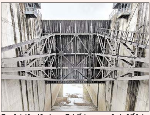
దెబ్బతిన్న కచ్చితంగా చెప్పలేమంటూ ఇచ్చిన నివేదికల నేపథ్యంలో తదుపరి ఏం చర్యలు చేపట్టాలనే దానిపై మంత్రివర్గంలో నిర్ణయం తీసుకోనున్నారు. కాగా,