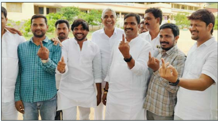
భువనగిరి (వాయిస్ టుడే ప్రతినిధి) :- నల్గొండ,వరంగల్, ఖమ్మం గ్రామ్యులలో ఎమ్మెల్సీ ఎన్నికల పోలింగ్ లో భాగంగా యాదాద్రిగుట్టలో ఓటు హక్కు వినియోగించుకున్న ప్రభుత్వ విప్, ఆలేరు ఎమ్మెల్యే బిర్ల విలయ్య తదితరుల దృశ్యం.