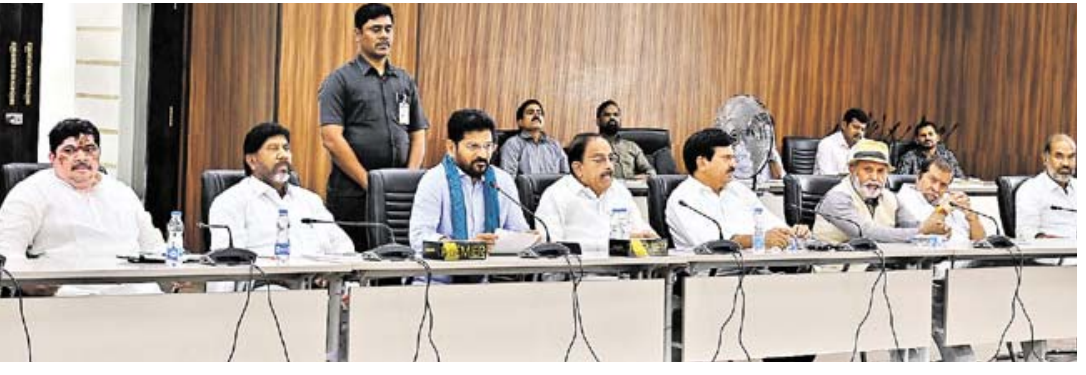
ప్రభుత్వం సంక్షేమానికి రూ.30వేల కోట్లు ఖర్చు చేసింది" అని సీఎం రేవంత్ రెడ్డి వివరించారు.

సాయంత్రం 4గంటలకు రూ.లక్ష వరకు ఉన్న రైతు రుణాలు మాఫీ చేస్తున్నాం. రూ.7వేల కోట్లు నేరుగా రైతుల ఖాతాల్లోకి వెళతాయి. నెలాఖరులోగా రూ.లక్షవరకు వరకు ఉన్న రుణాలు మాఫీ చేస్తాం. ఆగస్టులోగా రూ.2లక్షల వరకు ఉన్న రుణాలు మాఫీ చేసి ఆ ప్రక్రియను పూర్తి చేస్తాం. రుణమాఫీ పేరుతో తనీఆల్ లాగా మాటలు చెప్పి రైతులను మభ్యపెట్టడం లేదు. రైతు రుణమాఫీపై ప్రభుత్వానికి చిత్తశుద్ధి ఉంది. అందుకే ఏక మొత్తంలో రూ.2లక్షల రుణమాఫీ పూర్తి చేస్తున్నాం. రైతు ఆత్మగౌరవాన్ని నిలబెట్టేందుకే రుణమాఫీ. మనం చేస్తున్న మంచి పనిని ప్రజలకు వివరించండి.