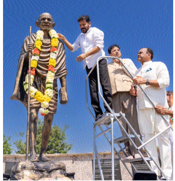
స్వాబ్ అంతర్జాతీయ స్థాయిలో గుర్తింపు పొందింది.