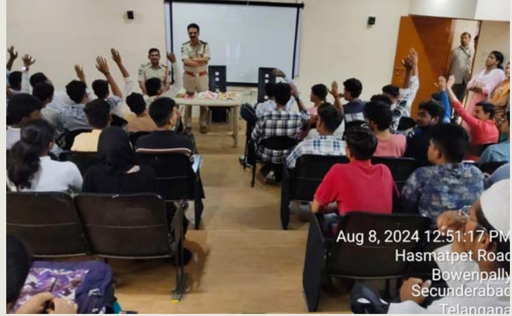
Aug 8, 2024 12:51:17 PM Hasmatpet Road Bowenpally Secunderabad Telangana