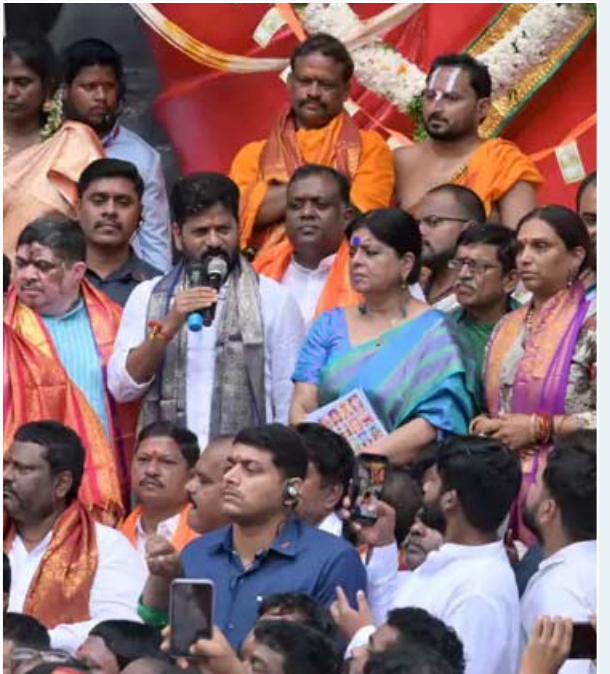
కలిసి జూబ్లీహిల్స్లోని తన నివాసంలో ఈ ఉదయం ప్రత్యేక పూజలు నిర్వహించారు. మరోవైపు రాష్ట్రవ్యాప్తంగా వేడుకలు ఘనంగా జరుగుతున్నాయి.