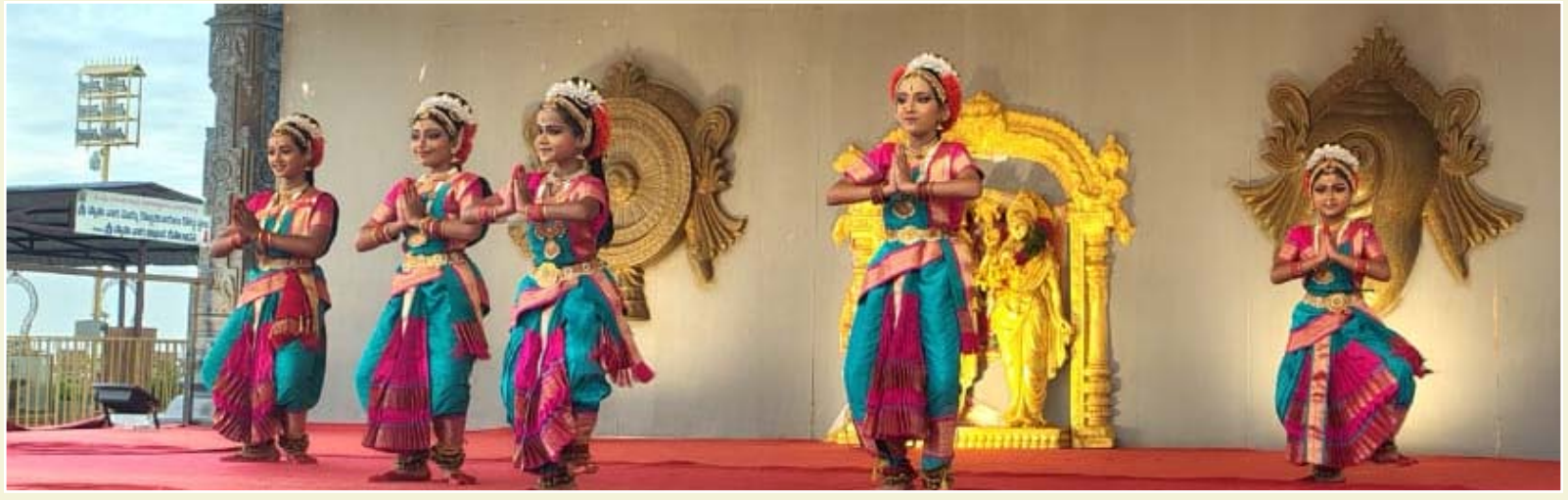
శ్రీ లక్ష్మీ స్వస్తింహ స్వామి దేవస్థానంలో ప్రాంగణంలో సాంస్కృతిక కార్యక్రమాలలో భాగంగా భవాని నృత్యాంజలి కళాక్షేత్రం భవాని హైదరాబాద్ బృందం వారిచే కూచిపూడి నృత్య ప్రదర్శన నిర్వహించబడినది. -వాయిస్ టుడే/యాదగిరిగట్టు: