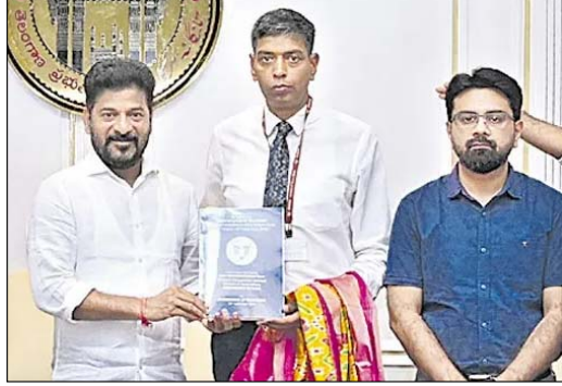
నిబంధనలు సడలించాలని విజ్ఞప్తి చేశారు.