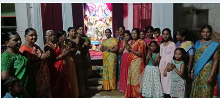
ఎస్ ఎల్ ఎస్ ఎస్ బాధ్యు యూత్ అసోసియేషన్ ఆధ్వర్యంలో గణేష్ ఉత్సవాలు ఘనంగా జరిగాయి యూదగిరిగుట్టలో 5వ వార్డు లో విఘ్నేశ్వర స్వామి పూజలు భక్తి శ్రద్ధలతో నిర్వహించారు.