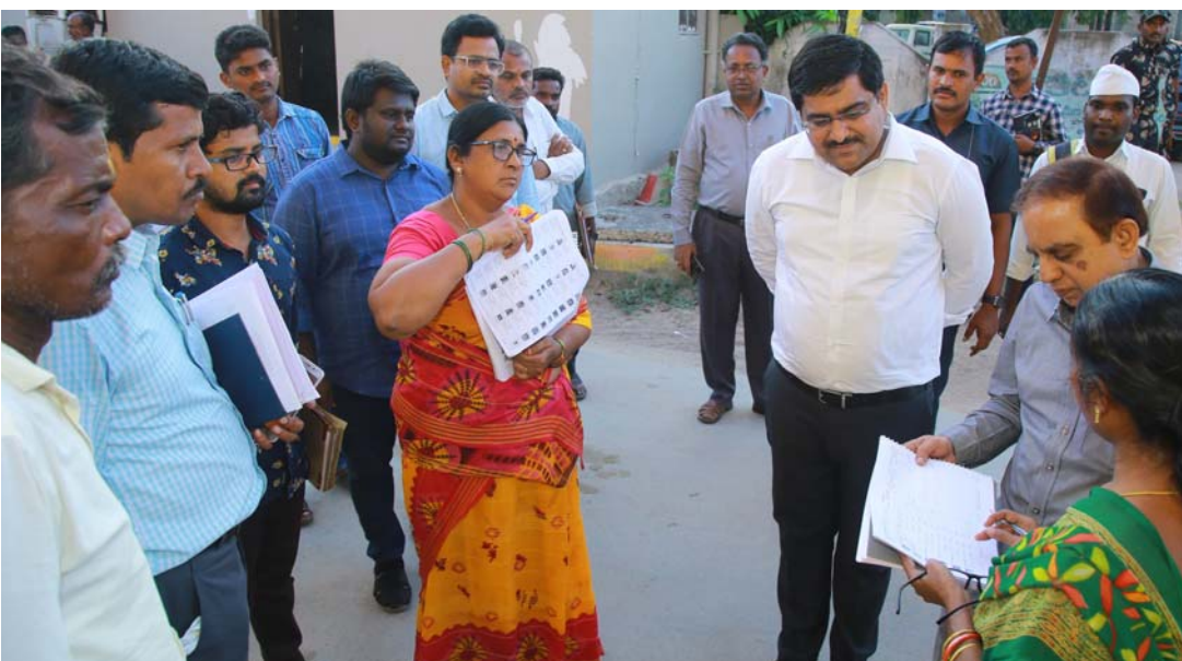
తీసుకోవాలని సూచించారు. మరణించిన వారి పేర్లను తొలగించేందుకు నిబంధనలను పాటించాలని, కుటుంబ సభ్యుల నుండి మరణ దృవీకరణ పత్రం తప్పనిసరిగా పొందాలని తెలిపారు. బాత్ లెవల్ అసిస్టెంట్లను నియమించేలా రాజకీయ పార్టీలకు లేఖలు వ్రాయాలని, డ్రాఫ్ట్ ఎలక్టోరల్ జాబితాలను వారికి ఇవ్వాలని తెలిపారు. అలాగే మార్కులు ఎలక్టోరల్ జాబితాను, దివ్యాంగులు, ఓల్డ్ ఏజ్ ఓటర్ల పరిశీలన జాగ్రత్తగా నిర్వహించాలని తెలిపారు. క్రమం తప్పకుండా ఇవిఎం గోదాములను, రిజిస్ట్రర్ నిర్వహణను