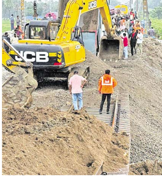
విజయవాడ మార్గంలో మంగళవారం కూడా పెద్దసంఖ్యలో రైళ్లు రద్దయ్యాయి. ఆదివారం నుంచి మంగళవారం సాయంత్రం వరకు రద్దయిన రైళ్ల సంఖ్య 563కి పెరిగింది. 185 రైళ్లను దారి మళ్లించి నడిపిస్తున్నారు. 3, 4 తేదీల్లో పదుల సంఖ్యలో రైళ్లను ద.మ.రైల్వే రద్ద చేసింది.

హైదరాబాద్: కాజీపేట-విజయవాడ సెక్షన్లో వర్షాలకు దెబ్బతిన్న ట్రాక్ ను పునరుద్ధరించే పనులు కొనసాగుతున్నాయి. చెరువుల నుంచి నీటి ప్రవాహం వస్తుండడం, వర్షం కురుస్తుండటంతో పనుల్లో జాప్యం జరుగుతోంది. మంగళవారం సాయంత్రానికి తాళ్లపూసపల్లి-మహబూబాబాద్ మధ్య పునరుద్ధరణ పనులు దాదాపు పూర్తయ్యాయని ద.మ.రైల్వే వర్గాలు తెలిపాయి. ఇంటికన్నె-కేసముద్రం మధ్య ట్రాక్ పనులు కీలకదశకు వచ్చాయి. బుధవారం సాయంత్రానికి రైళ్ల రాకపోకల్ని పూర్తిస్థాయిలో పునరుద్ధరించే లక్ష్యంతో పనిచేస్తున్నట్లు రైల్వే వర్గాల సమాచారం. శనివారం అర్ధరాత్రి దాటక భారీగా వచ్చిన వరద ప్రవాహంతో తాళ్లపూసపల్లి-మహబూబాబాద్, ఇంటికన్నె-కేసముద్రం మధ్య రైలు పట్టాల కింద మట్టి, కంకర కొట్టుకుపోయింది. దీంతో 'ప్రత్యేక మాస్టర్స్ రైలు'లో స్వీపర్లు, రెయిల్వే, బండరాళ్లు, కంకరను ద.మ.రైల్వే తరలించింది. పట్టాలు వేలాడుతున్న ప్రాంతంలో కింది భాగాన్ని బండరాళ్లు, కంకర, మొరంతో నింపుతున్నారు. 'వర్షం పడుతుండడం... నీటి ప్రవాహం వస్తుండటంతో పెద్దపెద్ద బండరాళ్లతో అడ్డుకట్టలా వేస్తున్నాం. బుధవారం ఉదయానికి ఒక లైన్ పునరుద్ధరించి రైళ్ల రాకపోకల్ని ప్రారంభిస్తాం. సాయంత్రానికి రెండో లైన్ నూ అందుబాటులోకి తెచ్చి పూర్తిస్థాయిలో నడిపిస్తాం' అని ద.మ.రైల్వే సీపీఆర్స్ ఎ.శ్రీధర్ తెలిపారు. కాజీపేట-