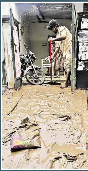
ఇంట్లో పేరుకుపోయిన ఒంట్లను బయటికి పంపించడానికి అవస్థలు పడుతున్న జలగంగరగర్కు చెందిన యువకుడు

తెలంగాణలో, ఎడతెరిపి లేకుండా కురుస్తున్న వర్షాల కారణంగా లోతట్టు ప్రాంతాలు జలమయం కావడం, వ్యవసాయ పంటలకు నష్టం వాటిల్లడంతోపాటు పొరుగున ఉన్న ఆంధ్రప్రదేశ్లో రాష్ట్ర రైలు, రోడ్డు మార్గాలకు అంతరాయం ఏర్పడింది... తెలంగాణ మరియు ఆంధ్రప్రదేశ్లో కుండపోత వర్షాలు కొనసాగుతున్నందున రెండు రాష్ట్రాల్లో కనీసం 35 మంది మరణించారు మరియు 1,000 మందికి పైగా నిరాశ్రయులయ్యారు. గత మూడు రోజులుగా కురుస్తున్న భారీ వర్షాల కారణంగా రోడ్లు, రైలు పట్టాలు దెబ్బతిన్నాయి, వేలాది ఎకరాల్లో పంటలు నీట మునిగాయి, ప్రజలు నిత్యావసరాల కోసం అల్లాడుతున్నారు, ఎజెన్సీలు సహాయ, సహాయ కార్యక్రమాల్లో నిమగ్నమై, రెండు రాష్ట్రాల ముఖ్యమంత్రులు పరిష్కరించడానికి ప్రయత్నాలు ముమ్మరం చేశారు. పరిస్థితి. మంగళవారం రెండు రాష్ట్రాల్లో కొన్ని ప్రాంతాల్లో మరింత వర్షాలు కురుస్తాయని భారత వాతావరణ విభాగం (ఐఎంఓ) అంచనా వేసింది. - వాయిస్ టుడే ప్రత్యేక ప్రతినిధి