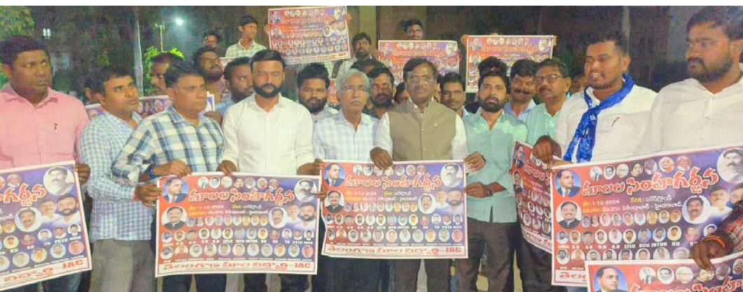
కులానికి వ్యతిరేకం కాదని తెలిపారు. రాష్ట్రంలోని మాలలు, మాల అనుబంధ కులాలు ఆర్థిక, రాజకీయ, సామాజిక రంగాలలో అభివృద్ధి కొరకు సింహగర్జనను నిర్వహించనున్నట్లు చెప్పారు. ఈ సభతో మాలల ఐక్యత సమాజానికి చూపెట్టాలని అన్నారు. రాష్ట్రం నలుమూలల నుంచి మాలలు ప్రతీ ఇంటి నుంచి స్వచ్ఛందంగా తరలిరావాలని కోరారు. ఈ కార్యక్రమంలో ఓయూ