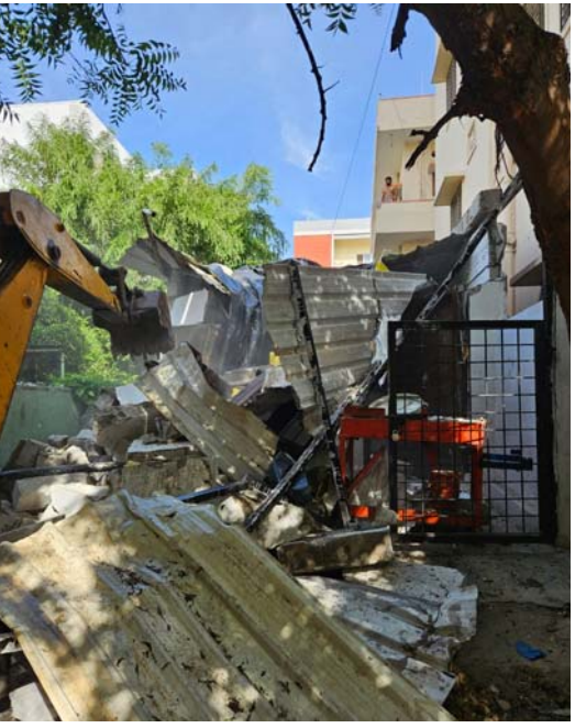
నాలాపై నిర్మించిన అక్రమ నిర్మాణాలను గతంలో జిహెచ్ఎసి అధికారులు తొలగించిన దృశ్యం