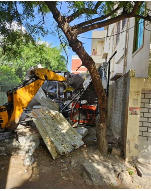
నాలాపై నిర్మించిన అక్రమ నిర్మాణాలను గతంలో జిహెచ్ఎసి అధికారులు తొలగించిన దృశ్యం