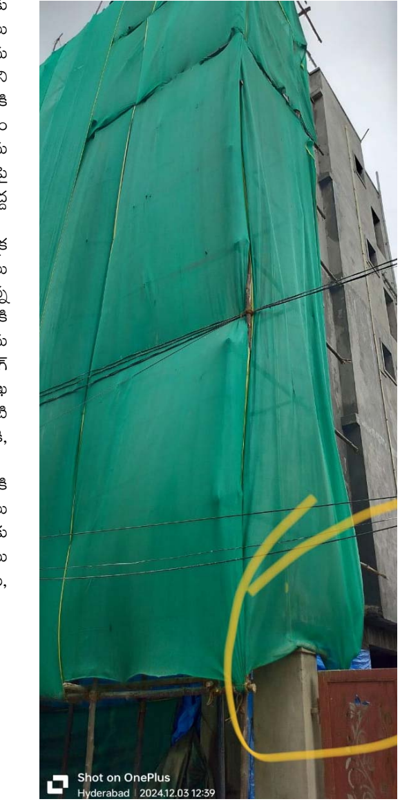
మాకు ఎలాంటి సంబంధం లేదనుకొని అధికారులు బాధ్యతల్ని విస్మరిస్తూ నిర్మాణదారులపై చర్యలే తీసుకోవట్లేదు. కొన్ని సందర్భాల్లో ఆక్రమ నిర్మాణాలకి నోటీసులు ఇస్తున్నారు. కానీ పురాతన కట్టడాలని కూల్చి ఆక్రమ బహుళ అంతస్తుల నిర్మాణం చేపట్టిన వారిపై చర్యలు తీసుకోకుండా ఆక్రమ నిర్మాణదారులని మేమేమీ చేయలేము మాకేమి చేతకాదు అన్నట్లుగా వ్యవహరిస్తున్నారు అధికారులు. లాలాపేట్ లో పురాతన కట్టడాలను కూల్చి ఆక్రమ నిర్మాణాలు జరుగుతున్న అనేకమార్లు పత్రికల్లో కథనాలు ప్రచురితమైన అధికారుల దృష్టికి వెళ్లినా ఇంతవరకు అధికారులు చర్యలు తీసుకున్న డాఖలాలు లేవు. ఇకనైనా అధికారులు మొద్దు నిద్ర నుండి మేల్కొని పురాతన కట్టడాలను కూల్చిన నిర్మాణదారులపై చర్యలు తీసుకొని తమ ఉద్యోగ ధర్మాన్ని నిజాయితీగా నిర్వహించి బాధ్యతగల అధికారులుగా నిరూపించుకోవాలి అవసరం ఎంతైనా ఉందని ప్రజలు అంటున్నారు.