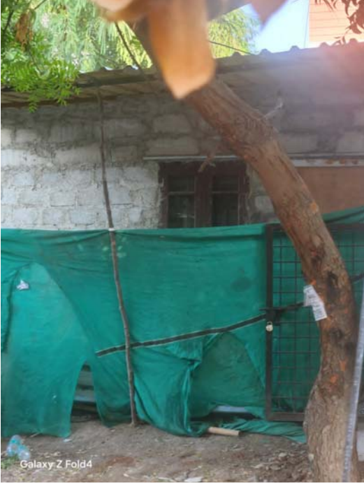
నాలాపై నిర్మించిన అక్రమ నిర్మాణాల ప్రస్తుత దృశ్యం

అని కాలనీ ప్రజలు ఆవేదన వ్యక్తం చేస్తున్నారు. నాలాపై ఇంటి నిర్మాణం చేపడితే విద్యుత్ అధికారులు మీటర్ ను ఎలా బిగిస్తారని, విద్యుత్ అధికారులకు ఏ మేర డబ్బులు ముట్టాయోనని ప్రజలు అంటున్నారు. ఏదీ ఏమైనా సరే విద్యుత్ విజిలెన్స్, జిహెచ్ఎసి విజిలెన్స్ అధికారులు చొరవ తీసుకుని నాలాపై నిర్మించిన అక్రమ నిర్మాణాలను వెంటనే తొలగించాలని, నరస్యతి కాలనీవాసులు ప్రభుత్వ అధికారులను డిమాండ్ చేశారు.