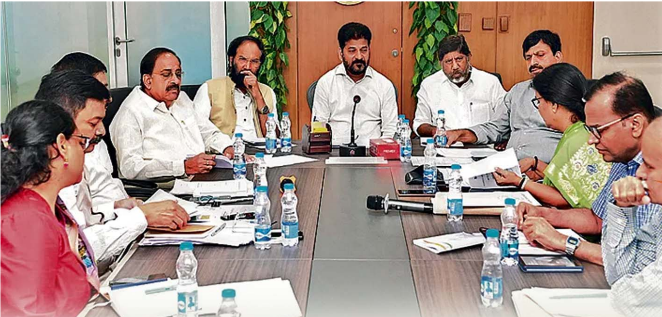
రాష్ట్ర ప్రభుత్వ ప్రజా సంక్షేమ దినోత్సవం