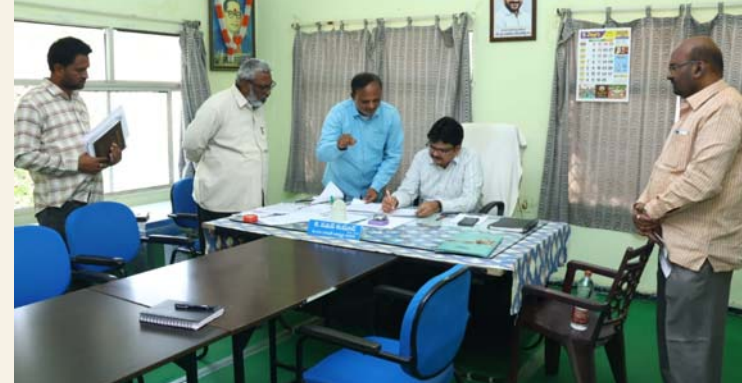
అర్జులైన వారందరికీ ప్రభుత్వ సంక్షేమ ఫలాలు అందించాలి