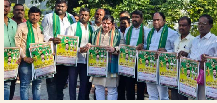
ఎరుకల కార్పొరేషన్ ఏర్పాటుకు కృషి చేస్తూ ముఖ్యమంత్రి దృష్టికి తీసుకెళ్తా.. మంత్రి పొన్నం ప్రభాకర్లు ఆయన నివాసంలో కలిసిన తెలంగాణ ఆదివాసి ఎరుకల సంఘం

ప్రజా పాలన ప్రారంభించే గ్రామాల జాబితా, గ్రామాలలో 4 పథకాల లబ్ధిదారుల వివరాలను నిర్ణీత నమూనాలో పంపాలని కలెక్టర్లకు సిఎస్ తెలిపారు. జనవరి 26న ఎంపిక చేసిన గ్రామాలలో మధ్యాహ్నం ఒంటి గంటకు 4 పథకాలను అధికారికంగా ప్రారంభించాలని అన్నారు. మండల ప్రత్యేక అధికారి అధ్యక్షులలో ఈ కార్యక్రమం జరగాలని, 4 పథకాలకు సంబంధించి సదురు గ్రామాల్లో అర్హులైన వారందరికీ లబ్ధి చేకూరేలా చూడాలని అన్నారు. 4 నూతన పథకాల లాంఛింగ్ లో అర్హులు మాత్రమే జాబితాలో ఉండేలా అప్రమత్తంగా ఉండాలని, గ్రామ సభలలో స్వీకరించిన నూతన దరఖాస్తులను సైతం పరిశీలించి అర్హులు ఉంటే రేపటి జాబితాలో యాద్ చేయాలని అన్నారు. నూతన రేషన్ కార్డుల జారీ ను తహసీల్దార్ బృందం, ఇందిరమ్మ ఇండ్ల జాబితాను ఎంపీడీవో బృందం, రైతు భరోసా జాబితా ను మండల వ్యవసాయ అధికారి బృందం, ఇందిరమ్మ రైతు భరోసా జాబితా ను ఏపిఐ, %౫౦% నరేగా బృందం పరిశీలించి, ఆ జాబితాలో అర్హులు మాత్రమే ఉండేలా పథకాలు పటిష్ట చర్యలు తీసుకోవాలని అన్నారు. నూతన