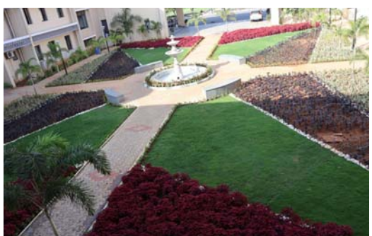
జరిగింది. సమీకృత జిల్లా కార్యాలయాల సముదాయం వద్ద

ఖమ్మం, ఫిబ్రవరి-1. ( వాయిస్ టుడే ): ఖమ్మం జిల్లా కలెక్టరేట్ కార్యాలయంలో పచ్చదనం పెంపుకు చర్యలు తీసుకుంటూ ఆహ్లాదకరమైన వాతావరణం ఉండే విధంగా గార్డెనింగ్ ఏర్పాటు చేయడం జరిగింది. జిల్లా కలెక్టర్ ముజమ్మిల్ ఖాన్ ప్రత్యేక శ్రద్ధతో ఉద్యానవన శాఖ ఆధ్వర్యంలో సమీకృత జిల్లా కలెక్టరేట్ నందు పచ్చదనం, ఆహ్లాదకరమైన వాతావరణం ఏర్పాటులో భాగంగా పూలు, అలంకరణ, వివిధ రకాల మొక్కలను నాటడం జరిగింది. కలెక్టరేట్ లోని ఫౌంటెన్ చుట్టూ, ఆవరణ చుట్టూ అలంకరణ మొక్కలను నాటడంతో పాటు పూల మొక్కలను కుండీలలో కార్యాలయం ముందు భాగంలో ఉంచడం జరిగింది. సమీకృత జిల్లా కార్యాలయాల సముదాయం వద్ద