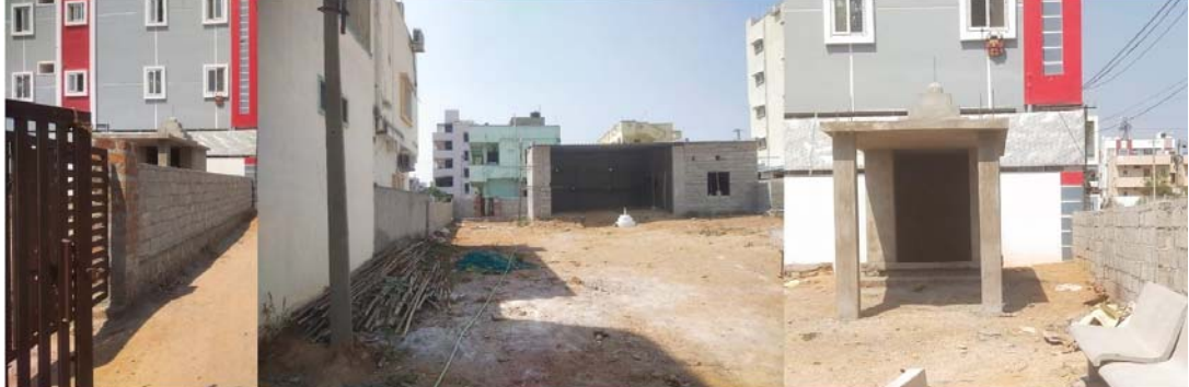
కాలనీలోని రోడ్ నంబరు 6, 5, కమ్యూనిటీ హాల్ ఎదురుగా ఉన్న రోడ్లు, రోడ్ నంబరు 4 అడ్డరోడ్లు. మధ్యలో ఆగిపోయిన కమ్యూనిటీ హాల్, ప్రహరీగోడ, పోచమ్మ తల్లి గుడి.

హయత్ నగర్ (వాయిస్ టుడే) పట్టణాభివృద్ధి ప్రణాళికల్లో తమ కాలనీని పూర్తిగా విస్మరిస్తున్నారని వర్ణనగర్ కాలనీవాసులు తీవ్ర ఆవేదన వ్యక్తం చేస్తున్నారు. కమ్యూనిటీ హాల్, ప్రహరీగోడ నిర్మాణం, అంతర్గత రహదారుల వంటి మౌలిక వసతుల కల్పనపై ఎన్నికల సమయంలో భారీ హామీలు ఇచ్చిన నేతలు, ఎన్నికల అనంతరం “చూద్దాం... చేద్దాం” అంటూ కాలక్షేపం చేస్తూ సమస్యలను పూర్తిగా పట్టించుకోవడం లేదని వర్ణనగర్ కాలనీవాసులు తీవ్ర ఆసంతుష్టి వ్యక్తం చేస్తున్నారు.