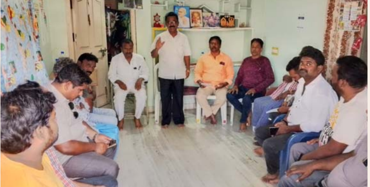
సాధిక సమస్యలు పరిష్కరించాలి ప్రభుత్వం ఇచ్చిన ఆరు హామీలను నెరవేర్చాలి