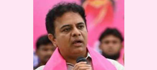
(మగతా 2వ పేజీలో)

రాజకీయ పోరాటం కాదు: రాహుల్ ఇది రాజకీయ పోరాటం కాదని కాంగ్రెస్ ఎంపీ రాహుల్ గాంధీ తేల్చిచెప్పారు. రాజ్యాంగం, ప్రజాస్వామ్య పరిరక్షణ కోసమే పోరాటం ప్రారంభించామని స్పష్టంచేశారు. నిరసన ర్యాలీ సందర్భంగా ఆయన మాట్లాడారు. చట్ట ప్రకారం ఒక్కరికి ఒక ఓటు మాత్రమే ఉండాలన్నారు. అక్రమాలు, అవకతవకలకు తావులేని స్వచ్ఛమైన, స్పష్టమైన ఓటర్ జాబితా కోసం ఉద్యమిస్తున్నామని ఉద్ఘాటించారు. ఎన్నికల్లో జరుగుతున్న అక్రమాల గురించి ప్రజలందరికీ తెలుసని చెప్పారు. ఎన్నికల సంఘం దీనిపై స్పందించడం లేదని నిలదీశారు. గత ఎన్నికల్లో దేశమంతటా జరిగిన లిగ్గింగ్ పై త్వరలో బాంబు పేలుస్తానని రాహుల్ మరోసారి వెల్లడించారు. ఎన్నికల సంఘం కోరుతున్నట్లుగా సంతకం చేసిన అఫిడవిట్ సమర్పించే ప్రసక్తి లేదన్నారు. ఎన్నికల సంఘం వెబ్ సైట్ నుంచి తీసుకున్న సమాచారాన్ని విశ్లేషించి, ఓట్ల చోరీని బయటపెట్టానని, ఇంతకంటే సాక్ష్యాధారాలు ఇంకేం కావాలని ప్రశ్నించారు. అది తాను స్పష్టించిన దేలా కాదని స్పష్టంచేశారు.