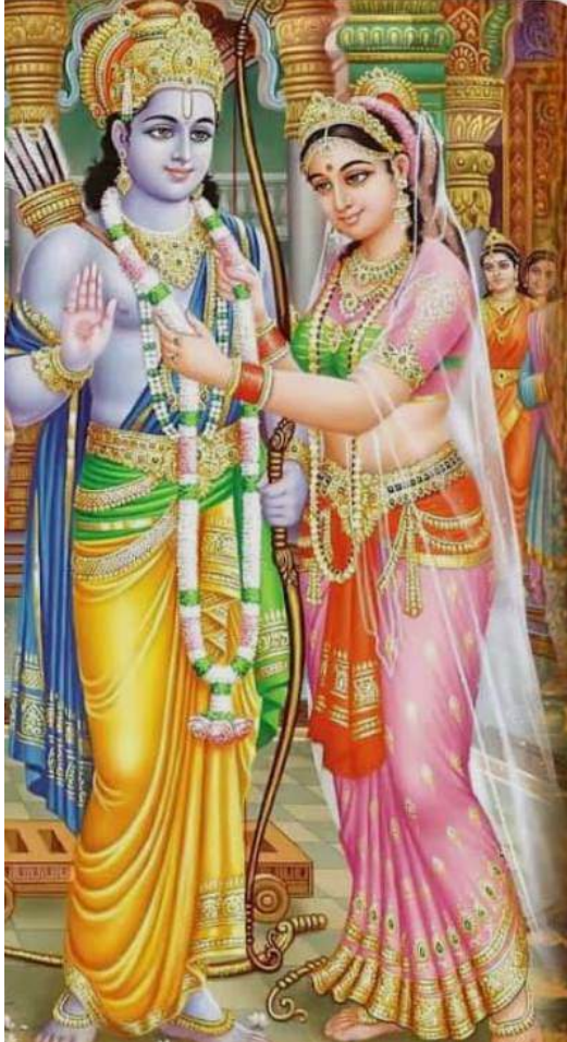
నిర్వహించనున్నట్లు దేవస్థాన అధికారులు తెలిపారు. రాజన్న ఆలయం అభివృద్ధిలో భాగంగా నిర్వహిస్తున్న ధార్మిక కార్యక్రమాలను ఆలయ అర్చకులు, వేద పండితులు