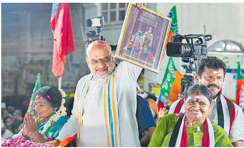
బలపడుతోందని, ఏబిఎడీఎంకే నేత ఎడప్పాడి కె.వెంకటేశ్వర్లు నాయకత్వంలో ప్రభుత్వం ఏర్పడుతుందని విశ్వాసం వ్యక్తం చేశారు. ఎన్డీఎ అధికారంలోకి వస్తేనే శాంతిభద్రతలు మెరుగుతాయని, అభివృద్ధి సాధ్యమవుతుందని తెలిపారు. రాష్ట్రంలో బీజేపీకి పెరుగుతున్న ప్రజా మద్దతు మార్పు సంతోషమని ఆయన వ్యాఖ్యానించారు.

చెన్నై: మహిళా రిజర్వేషన్ బిల్లుపై లోక్ సభలో జరిగిన ఓటింగ్ నేపథ్యంలో రాజకీయ విమర్శలు తీవ్రపాటు దాల్చాయి. కేంద్ర హోంమంత్రి అమిత్ షా ప్రతిపక్షాలపై ఘాటు వ్యాఖ్యలు చేస్తూ, కాంగ్రెస్, డీఎంకే పార్టీలు మహిళలకు అన్యాయం చేశాయని ఆరోపించారు. మహిళల ప్రాతినిధ్యాన్ని పెంచే కీలక అవకాశాన్ని అవి అడ్డుకున్నాయని పేర్కొన్నారు. ప్రధాని నరేంద్ర మోదీ నాయకత్వంలోని కేంద్ర ప్రభుత్వం మాత్రమే మహిళా సాధికారత కోసం కట్టుబడి ఉందని స్పష్టం చేశారు. తమిళనాడులో ఎన్నికల ప్రచారంలో భాగంగా మోదీకుంది నియోజకవర్గంలో జరిగిన రోడ్ షోలో ఆయన మాట్లాడారు. ఈ సందర్భంగా డీఎంకే ప్రభుత్వంపై కుటుంబ రాజకీయాల ఆరోపణలు గుప్పిస్తూ, సీఎం స్థాలిన్ తన కుమారుడు ఉదయనిధిని ముందుకు తీసుకురావడంపైనే దృష్టి పెట్టారని విమర్శించారు. ఇలాంటి రాజకీయాలు ప్రజాస్వామ్యానికి హానికరమని అన్నారు. రాష్ట్రంలో ఎన్డీఎ కూటమి