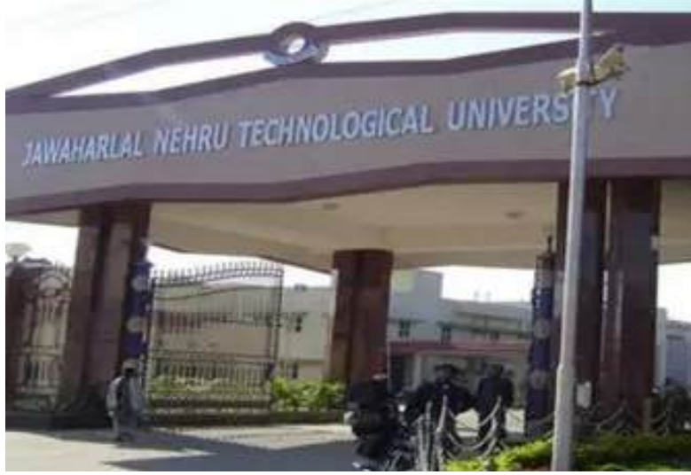
కంపెనీల్లో రూ. 26 లక్షల వార్షిక వేతనంతో కన్సల్టెంట్ కొలువులు సాధించారు. మొత్తానికి, విద్యార్థుల మేధానాన్ని చట్టపరమైన రక్షణ కల్పిస్తూనే, వారి భవిష్యత్తుకు ఈ కోర్సులు బంగారు బాటలు వేస్తున్నాయి.

ఈ కోర్సులు పూర్తి చేసిన వారికి బహుళజాతి సంస్థల్లో అద్యుతమైన ఉపాధి అవకాశాలు లభిస్తున్నాయి. ఐటీ సంస్థలకు కన్సల్టెంట్లుగా పూర్వహరిస్తూ సొంతంగానూ ఎదగవచ్చు. ఓయూలో న్యాయశాస్త్రంతో పాటు ఈ ప్రత్యేక కోర్సులు చదివిన విద్యార్థులు ఎంఎస్సీలలో ఏడాదికి రూ. 30 లక్షల నుంచి రూ. 60 లక్షల వరకు జీతాన్ని అందుకుంటున్నారు. యూపీకి చెందిన ముగ్గురు విద్యార్థులు నెలకు రూ. 8 లక్షల వేతనంతో నలభైదారులుగా నియమితులయ్యారు. ఎల్.ఎల్.ఎమ్ పూర్తి చేసిన ఇద్దరు విద్యార్థులు మధ్యప్రదేశ్లోని ఐటీ కంపెనీల్లో రూ. 26 లక్షల వార్షిక వేతనంతో కన్సల్టెంట్ కొలువులు సాధించారు. మొత్తానికి, విద్యార్థుల మేధానాన్ని చట్టపరమైన రక్షణ కల్పిస్తూనే, వారి భవిష్యత్తుకు ఈ కోర్సులు బంగారు బాటలు వేస్తున్నాయి.