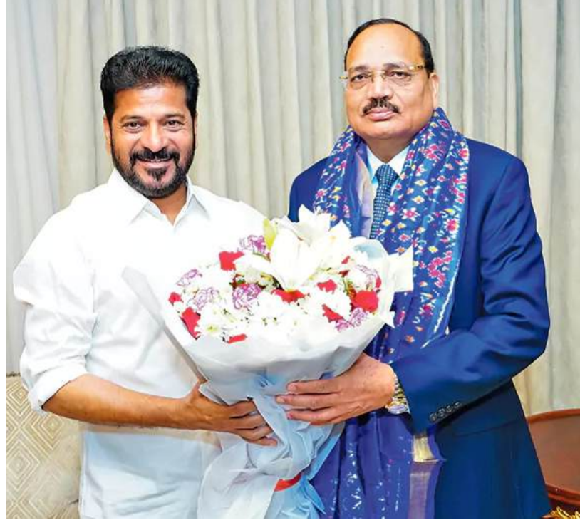
తదితరులు పాల్గొన్నున్నారు. రాష్ట్ర హైకోర్టు న్యాయమూర్తులు, ఉన్నతాధికారులు కూడా హాజరుకానున్నారు. హైకోర్టు విస్తరణతో న్యాయ సేవలు మరింత వేగవంతం అవుతాయని అధికారులు పేర్కొంటున్నారు.

జోన్--2 భవన నిర్మాణానికి నేడు శంకుస్థాపన హైదరాబాద్కు చేరుకున్న సీజీఐ జస్టిస్ సూర్యకాంత్ శంషాబాద్ విమానాశ్రయంలో ఘన స్వాగతం సీఎం రేవంత్ రెడ్డితో మర్యాదపూర్వక భేటీ న్యాయమూర్తుల క్షార్వర్ణ నిర్మాణానికి శ్రీకారం అత్యాధునిక సదుపాయాలతో హైకోర్టు విస్తరణ సుప్రీంకోర్టు న్యాయమూర్తుల పాల్గొనిక రాజేంద్రనగర్లో కీలక కార్యక్రమానికి ఏర్పాటు పూర్తి