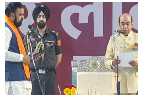
బీహార్ లో కొత్త శకం.. తొలి బీజేపీ సీఎంగా సామ్రాట్ చౌదరి ప్రమాణం

HYDERABAD RANGAREDDY NALGONDA MAHABOBNAGAR MEDAK KHAMMAM KARIMNAGAR WARANGAL NIZAMABAD ADILABAD