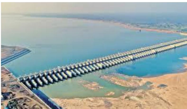
కాళేశ్వరం, దేవదుల మోటార్లను పాడు చేస్తున్నారా? హరిశోభ లేఖ

సుందర్ బ్యారేజీల నిర్మాణం.. వాటి నిర్వహణలో జరిగిన అవకతవకలు జరిగాయని పేర్కొన్న రేవంత్ రెడ్డి ప్రభుత్వం.. విచారణ జరిపేందుకు జస్టిస్ పీసీ ఘోష్ నేతృత్వంలో ఒక కమిషన్ ఏర్పాటు చేసింది. ఈ నేపథ్యంలోనే ఆ కమిషన్ చెల్లుబాటుపై హైకోర్టులో బీఆర్ఎస్ నేతలు పిటిషన్లు దాఖలు చేయగా.. వాటిపై నేటితో వాదనలు ముగిశాయి. ఈ క్రమంలోనే ఈ నెల 22వ తేదీన తుది తీర్పు వెలువరించనున్నట్లు హైకోర్టు తేల్చి చెప్పింది. 2024 మార్చి 14వ తేదీన జీవో నంబర్ 6ను జారీ చేసిన రాష్ట్ర ప్రభుత్వం.. కాళేశ్వరం ప్రాజెక్టు నిర్మాణం, నిర్వహణలో జరిగిన అవకతవకలపై విచారణ జరిపేందుకు జస్టిస్ పీసీ ఘోష్ కమిషన్ను ఏర్పాటు చేసింది. జస్టిస్ పీసీ ఘోష్ కమిషన్ ఏర్పాటుకు సంబంధించిన జీవోను సవాల్ చేస్తూ రాష్ట్రంలోని పలువురు కీలక నేతలు, అధికారులు తెలంగాణ హైకోర్టును ఆశ్రయించారు. బీఆర్ఎస్ అధినేత, తెలంగాణ మాజీ ముఖ్యమంత్రి కేసీఆర్.. మాజీ మంత్రి హరీష్ రావు, ఐఎఎస్ అధికారిణి సీతా సబర్వాల్, మాజీ ఐఎఎస్ అధికారి ఎన్.కె. జోషి సహా పలువురు హైకోర్టులో వేర్వేరుగా పిటిషన్లు దాఖలు చేశారు. జస్టిస్ పీసీ ఘోష్ కమిషన్ విచారణ ప్రక్రియలో రూల్స్ను ఉల్లంఘించారంటూ పిటిషన్లన్నీ వ్యాఖ్యానించారు. తమపై అభియోగాలు మోపే ముందు.. తమ వైపు నుంచి జస్టిస్ పీసీ ఘోష్ కమిషన్ వాదనలను పరిగణనలోకి తీసుకోలేదని వారు ఆరోపించారు. జస్టిస్ పీసీ ఘోష్ కమిషన్