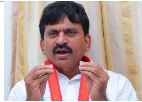
భూముల ధరల సవరణ, లిజిస్ట్రేషన్ కార్యాలయాల పనివేళలపై మంత్రి పాంగులేటి ఆదేశం

HYDERABAD RANGAREDDY NALGONDA MAHABOBNAGAR MEDAK KHAMMAM KARIMNAGAR WARANGAL NIZAMABAD ADILABAD