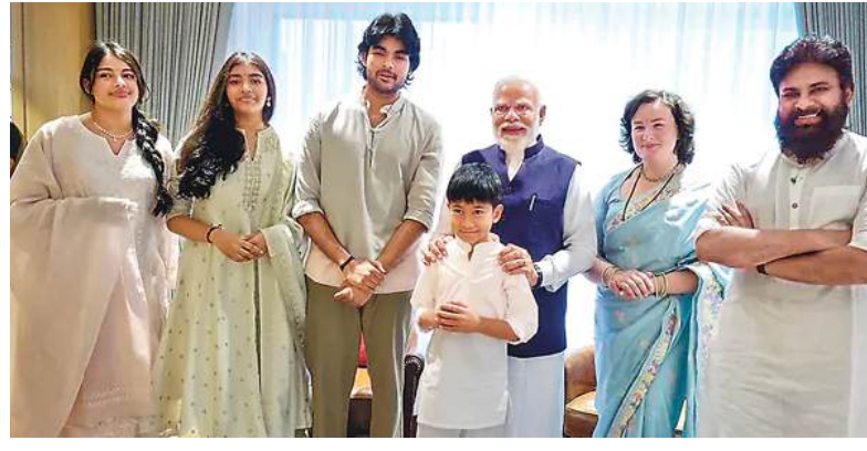
ఆయన గొప్పతనమని చెప్పారు. ప్రధాని ఆశీర్వాదాలు, మార్గదర్శకత్వం తనకు ఎప్పటికీ ప్రత్యేకమని, ఈ స్మరణీయ సందర్భాన్ని హృదయపూర్వక కృతజ్ఞతలు తెలియజేస్తున్నానని పవన్ కళ్యాణ్ తెలిపారు.