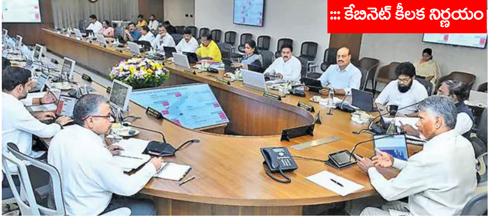
... కేబినెట్ కీలక నిర్ణయం

విజయవాడ, మే 14, (వాయిస్ టుడే) : ప్రపంచవ్యాప్తంగా నెలకొన్న ఖాళీలక, రాజకీయ ఉద్రిక్తతలు, ఆర్థిక సంక్షోభాల నేపథ్యంలో ఆంధ్రప్రదేశ్ ప్రభుత్వం అప్రమత్తమైంది. "నా దేశం - నా బాధ్యత" అనే నినాదంతో రాష్ట్రవ్యాప్తంగా భారీ పొదుపు చర్యలకు శ్రీకారం చుట్టింది. ముఖ్యమంత్రి అధ్యక్షతన జరిగిన క్యాబినెట్ సమావేశంలో ఈ మేరకు కీలక నిర్ణయాలు తీసుకున్నట్లు మంత్రి కౌలును పార్లమెంటులో వెల్లడించారు. సమావేశం అనంతరం ఆయన మీడియాతో మాట్లాడుతూ.. రాబోయే క్లిష్ట పరిస్థితులను ఎదుర్కొనేందుకు సమాజం సిద్ధంగా ఉండాలనే ఉద్దేశంతోనే ఈ ముందుజాగ్రత్త చర్యలు చేపడుతున్నామని స్పష్టం చేశారు. ప్రస్తుత అంతర్జాతీయ పరిస్థితుల వల్ల ఇంధన దిగుమతులు, విదేశీ మారక ద్రవ్యంపై తీవ్ర ఒత్తిడి పడుతోందని, వ్యవసాయ ఉత్పత్తుల ఎగుమతులకు అటంకాలు ఏర్పడే ప్రమాదం ఉందని మంత్రి వివరించారు. ఈ నేపథ్యంలో ప్రతి ఒక్కరూ బాధ్యతగా వ్యవహరించాలని, పొదుపు చర్యలు పాటించడం ద్వారా దేశానికి మేలు చేయాలని ముఖ్యమంత్రి పిలుపునిచ్చినట్లు తెలిపారు. ఈ పొదుపు చర్యలు తొలుత ప్రజాప్రతినిధులు, అధికారుల నుంచే ప్రారంభం