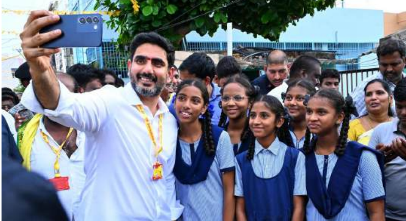
ప్రభుత్వ ప్రయత్నానికి ప్రశంసలు

ఈ ప్రయత్నం కేవలం ప్రచారానికి మాత్రమే పరిమితం కాకుండా, ఒక సామాజిక మార్పుకు నాంది పలుకుతోంది. ప్రైవేటు సంస్థల దోపిడీకి అడ్డుకట్ట వేయాలంటే ప్రభుత్వ బడులే శరణ్యమని భావించేలా చేస్తోంది. విద్యాశాఖ తీసుకున్న ఈ నిర్ణయంపై మేధావులు, విద్యావేత్తల నుంచి ప్రశంసలు అందుతున్నాయి. కేవలం అధికారుల మీదనే ఫోకస్ పెట్టకుండా, క్షేత్రస్థాయిలో విద్యార్థుల ప్రతిభను వెలుగులోకి తీసుకురావడం ద్వారా అటు ఉపాధ్యాయులను, ఇటు విద్యార్థులను ప్రభుత్వ ప్రోత్సహించినట్లు అయింది. వాస్తవానికి గత ఏడాదికంటే వదో తరగతి ఫలితాల్లో ఉత్తీర్ణత శాతం పెరిగింది. గత ఏడాది కంటే 4.15% ఉత్తీర్ణత నమూనా పెరిగింది. రాష్ట్రవ్యాప్తంగా 5,26,954 మంది ఉత్తీర్ణత సాధించారు. 83.69 శాతం మంది ప్రభుత్వ శ్రేణిలోనే ఉత్తీర్ణులయ్యారు. బాలల కంటే బాలికలే టాప్ గా నిలిచారు. 2161 పాఠశాలలో 100శాతం ఉత్తీర్ణత నమోదయింది. గతంలో ఎన్నడూ లేని విధంగా ప్రభుత్వ పాఠశాలల్లో ఉత్తీర్ణత శాతం పెరగడం అందర్నీ ఆకట్టుకుంది. పాఠశాల విద్యాశాఖలో తీసుకున్న చర్యలతోనే ఇది సాధ్యమైంది.