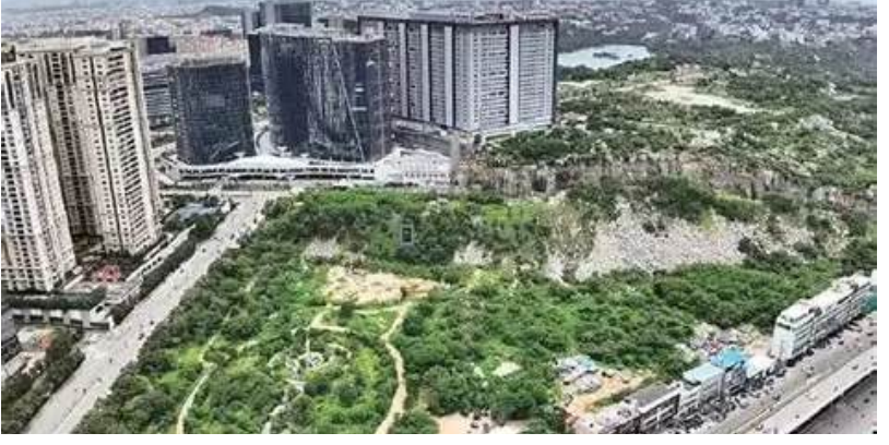
బంగారం కంటే ఎక్కువ విలువైనదిగా ఇన్వెస్టుర్లు భావిస్తున్నారు. ప్రస్తుతం వేలం చేసిన 6 ఎకరాల స్థలం హైటెక్ సీటీ, హైనాన్సియల్ డివెల్ప్ మెంట్ మరియు ఓఆర్ఆర్ కు అత్యంత సమీపంలో ఉండటమే దీనికి ప్రధాన కారణం. గతంలో కోకాపేట నియోఓబిస్ లో ఎకరం రూ. 100 కోట్లు దాటే పోటీలో అందరూ ఆశ్చర్యపోయారు. కానీ, ఇప్పుడు రాయదుర్గం ఆ రికార్డును ఎక్కడికో తీసుకెళ్లిపోయింది. ఈ ఒక్క వేలం ద్వారా ప్రభుత్వ ఖజానాకు వేల కోట్ల రూపాయల ఆదాయం సమకూరింది. హైదరాబాద్ రియల్ ఎస్టేట్ బామ్ అగ్రరాజ్యం అమెరికాతో పోటీ పడుతోందంటూ చర్చించుకుంటున్నారు. ఏదేమైనా, ఈ రికార్డు ధర హైదరాబాద్ బ్రాండ్ ఇమేజ్ ను మరోస్థాయికి తీసుకెళ్లడందంలో సందేహం లేదు.