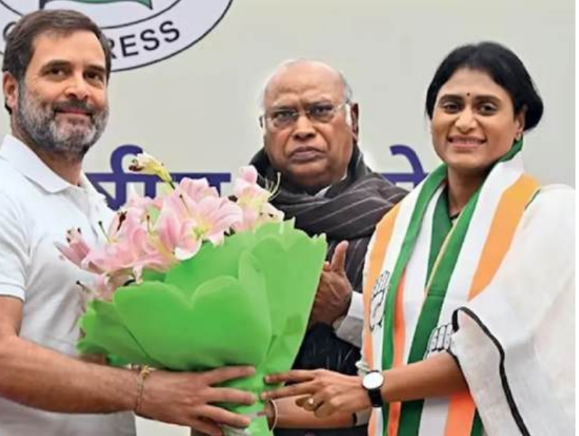
కలవడం గమనార్హం. ప్రస్తుతం కర్ణాటక నుంచి ముగ్గురు సభ్యులు కాంగ్రెస్ పార్టీ నుంచి రాజ్యసభకు ఎన్నిక కానున్నారు. ఈ నేపథ్యంలోనే వైఎస్ పర్షిలకు రాజ్యసభ అవకాశం దక్కుతుందా అనే ప్రచారం జరుగుతోంది. కర్ణాటక లేదా ఢిల్లీ నుంచి.. వైఎస్ పర్షిలకు రాజ్యసభ దక్కే అవకాశాలు ఉన్నాయని హస్తం పార్టీ వర్గాల్లో గుసగుసలు వినిపిస్తున్నాయి.