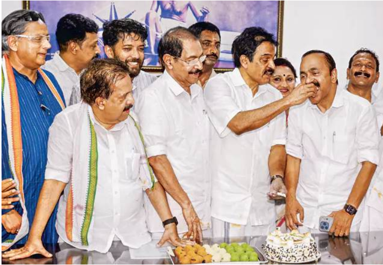
భద్రత లేదనే భావన ఓటర్లను యూడీఎఫ్ వైపు మళ్లించింది.

తిరువనంతపురం, మే 4 : కేరళ రాజకీయ చరిత్రలో ఒక సుదీర్ఘ అధ్యాయం ముగిసింది. దశాబ్ద కాలంగా సాగిన ఎల్ డీఎఫ్ పాలనకు స్పష్టి పలుకుతూ, కేరళ ఓటర్లు మళ్లీ యూడీఎఫ్ వైపు మొగ్గు చూపారు. "ప్రతి ఐదేళ్లకు ఒకసారి మార్పు" అనే కేరళ సంప్రదాయాన్ని గత ఎన్నికల్లో చెరిపివేసి చరిత్ర సృష్టించిన పినరయి విజయన్, ఈసారి మాత్రం ప్రజల తీర్పు ముందు తలవంచక తప్పలేదు. ముఖ్యమంత్రి పినరయి విజయన్ శైలి మొదటి నుంచి నియంతృత్వ ధోరణితో సాగుతుందనే విమర్శలు ఉన్నాయి. పార్టీలోనూ, ప్రభుత్వంలోనూ ఆయన మాట్లాడే శాసనం కావడంపై ప్రజల్లో అసహనం పెరిగింది. ముఖ్యంగా గత రెండేళ్లుగా ఆయనపై వచ్చిన అవినీతి ఆరోపణలు, ఆయన కార్యాలయం చుట్టూ తిరిగిన వివాదాలు ప్రభుత్వ ప్రతిష్టను దెబ్బతీశాయి. కెప్టెన్ అని అభిమానులు పిలుచుకునే విజయన్, ఈసారి ప్రజలకు అందుబాటులో లేని నేత గా మారిపోవడం ఎల్ డీఎఫ్ పతనానికి ప్రధాన కారణమైంది. కేరళ ఆర్థిక పరిస్థితి గతేడాది కాలంగా అత్యంత దారుణంగా తయారైంది. ప్రభుత్వ ఉద్యోగుల జీతాలు చెల్లించుకోలేక, సామాజిక పెన్షన్ల నిలిపివేత సామాన్య ప్రజల్లో తీవ్ర ఆగ్రహాన్ని కలిగించాయి. దీనికి తోడు కరువన్నారీ కోపరేటివ్ బ్యాంక్ కుంభకోణం వంటి అంశాలు కమ్యూనిస్టు పార్టీ క్షేత్రస్థాయి క్యాడర్లను కూడా ఆత్యర్థులలో పడేశాయి. సామాన్యుడి సామ్యుకు