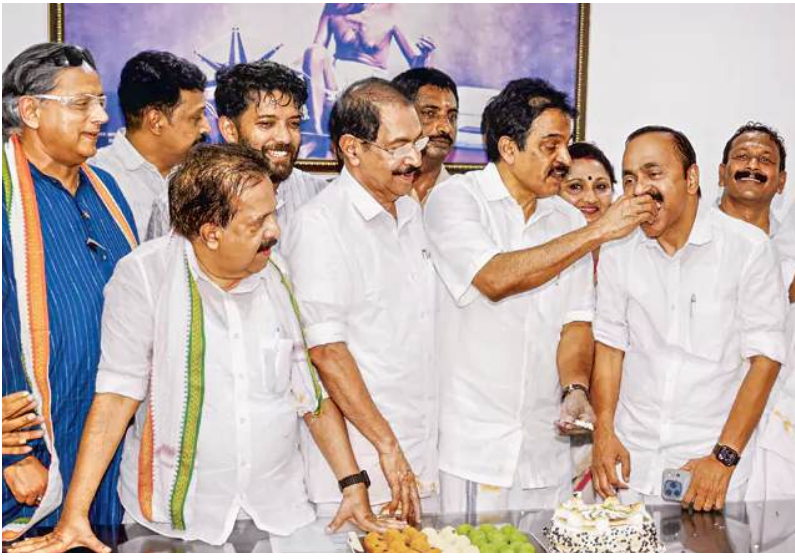
సుగమం చేశాయి. దశాబ్ద కాలం తర్వాత అధికార పీఠాన్ని అధిరోహిస్తున్న యూడీఎఫ్ ముందు ఇప్పుడు సవాళ్లు కొండంత ఉన్నాయి. ఆర్థిక సంక్షోభం నుంచి రాష్ట్రాన్ని గట్టెక్కించడమే కొత్త ప్రభుత్వం ముందున్న తక్షణ కర్తవ్యం.

కేరళలో నిరుద్యోగితా రేటు ఎక్కువగా ఉండటం, ప్రభుత్వం కేవలం పబ్లిక్ సర్వీస్ కమిషన్ నియామకాల్లో తమ అనుచరులకే ప్రాధాన్యత ఇస్తుందనే ఆరోపణలు యువతను కమ్మాన్వెస్టులకు దూరం చేశాయి. విద్యావంతులైన కేరళ యువత మెరుగైన అవకాశాల కోసం విదేశాలకు వలస వెళ్లాలి రావడంపై యూడీఎఫ్ చేసిన ప్రచారం క్షేత్రస్థాయిలో పనిచేసింది. మార్కుతోనే ఉపాధి అనే నినాదం యువ ఓటర్లను ఆకర్షించింది. కొన్ని కీలక నియోజకవర్గాల్లో బీజేపీ ఓట్లు యూడీఎఫ్ అభ్యర్థులకు బదిలీ అయ్యాయి. ఎలెక్షన్లను ఓడించాలనే ఉద్దేశంతో బీజేపీ పూర్వోత్సాహంగా వ్యవహరించిన వాదనలు వినిపిస్తున్నాయి. త్రిముఖ పోటీ జరిగిన చోట కూడా బీజేపీ ఓట్లు చీలిపోకుండా ఉండటం పరోక్షంగా కాంగ్రెస్ కూటమికి కలిసి వచ్చింది. కేరళ ఓటర్లు ఎప్పుడూ అతిగా అధికార గర్వం ప్రదర్శించే వారిని సహించరు. పినరయ విజయన్ సర్కార్ గత విజయం ఇచ్చిన అతివిశ్వాసంతో ప్రజాభిప్రాయాన్ని నిర్లక్ష్యం చేయడం, ఆర్థిక నిర్లక్ష్యంతో విఫలమవుడం యూడీఎఫ్కు మార్గం