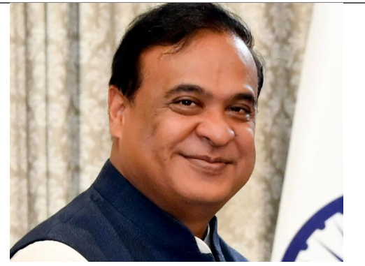
హిమంత్ కు కేంద్రంలో కీలక పదవి

HYDERABAD RANGAREDDY NALGONDA MAHABOBNAGAR MEDAK KHAMMAM KARIMNAGAR WARANGAL NIZAMABAD ADILABAD