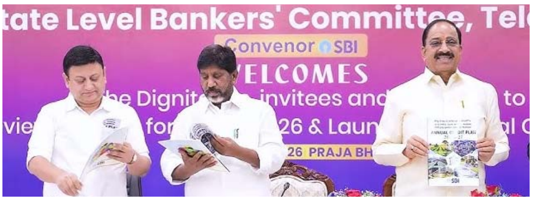
రుణాలు భవిష్యత్తు పెట్టబడదని పేర్కొంటూ, యువత ఉన్నత విద్య కోసం బ్యాంకులు మరింత సౌనుకూల దృక్పథంతో ముందుకు రావాలని కోరారు.

హైదరాబాద్: 2047 నాటికి తెలంగాణను 3 ట్రిలియన్ డాలర్ల ఆర్థిక వ్యవస్థగా అభివృద్ధి చేయడమే రాష్ట్ర ప్రభుత్వ లక్ష్యమని ఉప ముఖ్యమంత్రి మీర్ల శ్రీనివాస్ రెడ్డి ప్రకటించారు. సందర్భంగా, ఆర్థిక స్వావలంబన, మహిళా సాధికారత, పూర్వదర్ సీటీ నిర్మాణం, మూసీ నది పునరుజ్జీవనం వంటి అంశాలకు ప్రభుత్వం అత్యంత ప్రాధాన్యత ఇస్తోందని తెలిపారు. శుక్రవారం మహాత్మా జ్యోతిరావు పూలే ప్రజాభవన్ లో నిర్వహించిన 49వ రాష్ట్రస్థాయి బ్యాంకర్ల కమిటీ సమావేశంలో మంత్రి ఎం.ఎం.అశ్రఫ్ చిట్టా, ఉన్నతాధికారులు, ఆర్థిక ప్రతినిధులు, బ్యాంకుల ఉన్నతాధికారులతో కలిసి పాల్గొన్న భర్తీ విక్రమార్క రాష్ట్ర ఆర్థికాభివృద్ధి కీలక అంశాలను వెల్లడించారు.