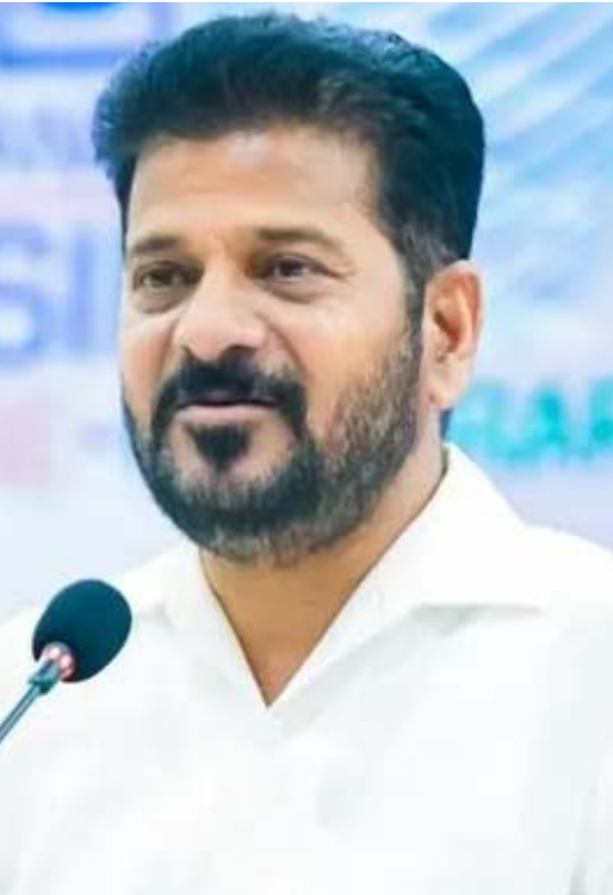
చర్చించుకుని ఎలా ముందుకెళ్లాలనేది నిర్ణయిస్తామని ఆన్నారు. కాళేశ్వరం వ్యవహారంపై సీబీఐ(కేంద్ర దర్యాప్తు సంస్థ) లేఖ రాసి 9 నెలలు గడిచినప్పటికీ ఎందుకు ముందుకెళ్లేదో మీరే అర్థం

పదవీ కాలం పూర్తయిన పీపీసీఎస్సెలను నామినేట్ పద్ధతిన నియమించాలని నిర్ణయం గజ్జిబౌలి స్టేడియాన్ని పీపీసీ పద్ధతిలో అభివృద్ధికి క్యాబినెట్ ఆమోద ముద్ర చిన్న కాళేశ్వరం ప్రాజెక్టు భూసేకరణ పూర్తి చేయాలని కేబినెట్ నిర్ణయం హాజీపూర్ రెవెన్యూ పరిధిలో ఇంటిగ్రేటెడ్ ఆక్సా పార్క్ ఏర్పాటుకు మంత్రివర్గం ఆమోదం ఇరిగేషన్ డిపార్ట్మెంట్ కు చెందిన 85.10 ఎకరాలను మత్స్య శాఖకు కేటాయిస్తూ నిర్ణయం ఆర్డీసీ సమ్మేటి స్పందించిన రేవంత్ రెడ్డి రేపు భట్టి విక్రమార్క ఆధ్వర్యంలో కార్మిక సంఘాలతో చర్చలు హైదరాబాద్ మే 23: సీఎం రేవంత్ రెడ్డి అధ్యక్షతన జరిగిన కేబినెట్ సమావేశంలో పలు కీలక అంశాలపై చర్చ జరిగింది. కేబినెట్ భేటీ అనంతరం నిర్ణయాలను మీడియా సమావేశంలో మంత్రులు వెల్లడించారు. ముఖ్యంగా ఆర్డీసీ కార్యక్రమాలను సమైక్యంగా ప్రాజెక్టు, పీపీసీఎస్సె తదితర అంశాలపై చర్చించినట్లు మంత్రులు వెల్లడించారు. జూనియర్ కళాశాలల్లోనూ మధ్యాహ్న భోజనం పథకం అమలు చేసేందుకు క్యాబినెట్ ఆమోదం - రాష్ట్ర అవిరూప వేడుకల్లో ప్రారంభించనున్నట్లు డిలివారు. కాళేశ్వరం అంశానికి సంబంధించి ఏవిధంగా ముందుకు వెళ్లాలనే విషయంపై ఇంకా నిర్ణయం తీసుకోలేదని మంత్రి ఉత్తమకుమార్ రెడ్డి వివరించారు. మంత్రుల సభకమిటీ వేసుకుని