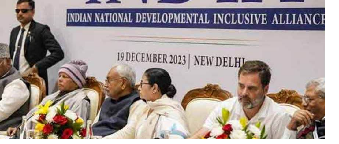
గమనార్హం. ఈ ప్రతిపక్షాల బక్యతా రాగానికి గండి కొడుతూ అరవింద్ కేలేవల్ నేతృత్వంలోని ఆమ్ ఆద్మీ పార్టీ, తమిళ నాడులో కాంగ్రెస్ పార్టీ డీపీకే ప్రభుత్వంలో చేరడంతో డీఎంకే ఈ సమావేశాన్ని బహిష్కరించాలని నిర్ణయించింది. అయితే నిన్ననే మమతా బెనర్జీ, అభిషేక్ బెనర్జీలు కేలేవల్ వారితో ప్రత్యేకంగా సమావేశమై భవిష్యత్ కార్యచరణపై చర్చలు జరిపినట్లుగా సమాచారం. కొన్ని పార్టీలు వ్యక్తిగత కారణాల వల్ల రాత్రేలతో వస్తున్నప్పటికీ, మోడీ ప్రభుత్వ విధానాలకు వ్యతిరేకంగా పోరాడతామని స్పష్టం చేశాయి. ఈ ప్రతిపక్షాల భేటీపై అధికార బీజేపీ తీవ్రంగా మండిపడింది. కూటమిలోని అంతర్గత లేఖను ప్రస్తావిస్తూ బీజేపీ ప్రతినిధి షెహజాద్ హునాలా విమర్శలు గుప్పించారు. ఇండియా కూటమికి ఎలాంటి మిషన్ (లక్ష్యం), విజన్ లేవని వారిలో ఉన్నదల్లా కేవలం కన్యూజ్, డివిజన్, పరస్పర ఆరోపణలు, పదవుల కోసం ఆరాటం మాత్రమేనని ఆయన ఎద్దేవా చేశారు. ఏదేమైనప్పటికీ, దేశంలో నిరుద్యోగం, ప్రవృత్తిని వంటి జాతీయ అంశాలపై ఉమ్మడి ముఖచిత్రాన్ని ప్రదర్శించేందుకు ప్రతిపక్షాల ఈ వేదికను వాడుకోవచ్చు.

న్యూఢిల్లీ, జూన్ 8, (వాయిస్ టుడే) : దేశ రాజధాని న్యూ ఢిల్లీ వేదికగా ప్రతిపక్ష ఇండియా కూటమి రాజ్ ఠాకూర్ రాష్ట్ర అసెంబ్లీ ఎన్నికలతో పాటు, 2029 లోకసభ ఎన్నికల్లో బీజేపీని ఉమ్మడిగా ఎలా ఎదుర్కోవాలనే దానిపై వ్యూహాలను సిద్ధం చేయడానికి ఈ భేటీని ఏర్పాటు చేశారు. ఢిల్లీలోని కాన్స్టిట్యూషన్ క్లబ్ లో జరగనున్న ఈ ఇండియా జనబంధన్ సమావేశానికి మొత్తం 23 ప్రతిపక్ష పార్టీలు హాజరవు తున్నట్లు కాంగ్రెస్ స్పష్టం చేసింది. ఈ సమావేశంలో కాంగ్రెస్ అగ్రనేతలు రాహుల్ గాంధీ, మల్లికార్జున ఖర్గే, డీఎస్సీ అధినేత్రి మమతా బెనర్జీ, అభిషేక్ బెనర్జీ, సమాజ్ వాదీ పార్టీ చీఫ్ అభిలెష్ యాదవ్, ఆర్డీసీ నేత తేజస్వి యాదవ్, శివసేన (యాబీటీ) అధినేత ఉద్ధవ్ రాత్రేలతో పాటు పలు లెఫ్ట్ పార్టీలు, చిన్న పార్టీలు నేతలు పాల్గొననున్నారు. ఇటీవల జరిగిన అసెంబ్లీ ఎన్నికల్లో బలమైన ప్రాంతీయ పార్టీలైన డీఎంసీ (శివుమి కాలి), డీఎంకే (తమిళనాడు) పరా ఆయిం పాలవడంతో కూటమిలో సమీకరణాలు మారాయి. ముఖ్యంగా బెంగాల్ లో తమ నేతలపై జరుగుతున్న దాడుల అంశాన్ని డీఎంసీ ఇక్కడ లేవనెత్తనుంది. అలాగే కేరళ ఎన్నికల్లో కాంగ్రెస్-బీజేపీ మధ్య రహస్య ఒప్పందం ఉందంటూ వచ్చిన ఆరోపణలపై సీపీఐ(ఎం) పార్టీ కాంగ్రెస్ నాయకత్వాన్ని వివరణ కోరనుంది. కూటమిలో భిన్నత్వం కోరి ఏకత్వం ఉందని కాంగ్రెస్ నేత జైరాం రమేష్ పేర్కొన్నప్పటికీ, కొన్ని కీలక పార్టీలు ఈ భేటీకి దూరం కావడం