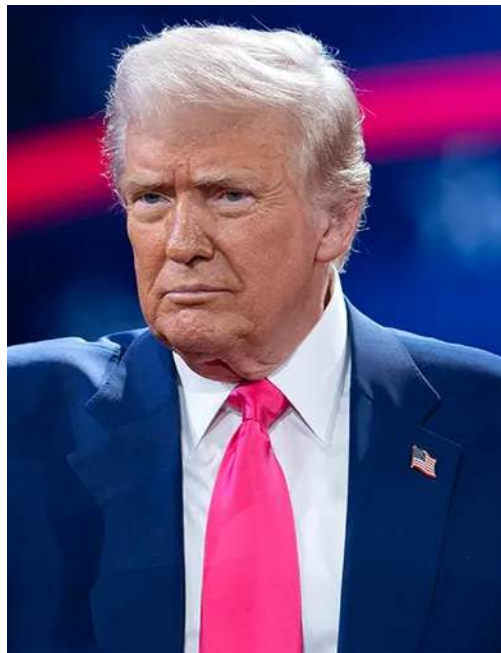
(మగతా 2వ పేజీలో)