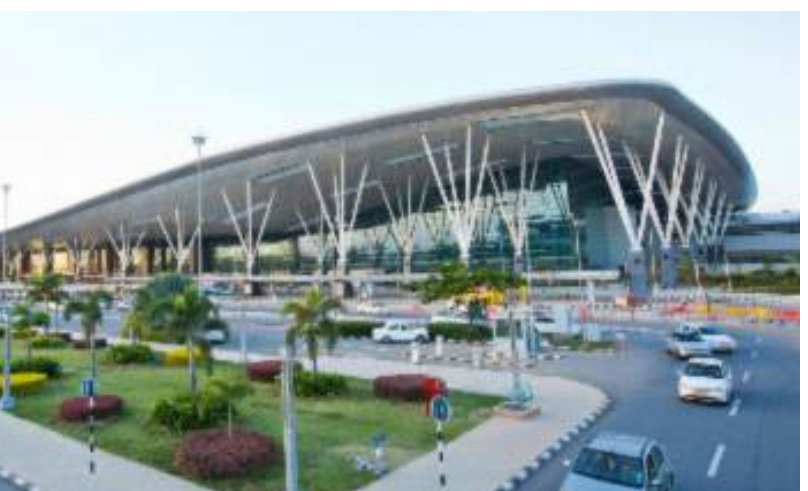
మీదుగా చేరుకోవాలి అనుకున్నా గంటన్నర సమయం పడుతుంది హనుమంతువాక నుంచి అడవిపరం, అనంతపురం మీదుగా భోగాపురానికి 1.40 గంటల సమయం పట్టి అవకాశం ఉంది. అయితే భోగాపురం ఎయిర్ పోర్ట్ కు ప్రత్యేకంగా రోడ్డు మార్గం ఏర్పాటు చేస్తే బాగుంటుంది. ట్రాఫిక్ క్రమబద్ధీకరణకు కఠిన అంశాలు అమలు చేయాల్సి ఉంటుంది. ఇప్పటికే విఎంఆర్డిఏ ఏడు రహదారులను ప్రతిపాదించింది. వాటిని అందుబాటులోకి తెస్తే కానీ.. భోగాపురం ఎయిర్ పోర్ట్ కు ప్రయాణభారం తప్పదు.