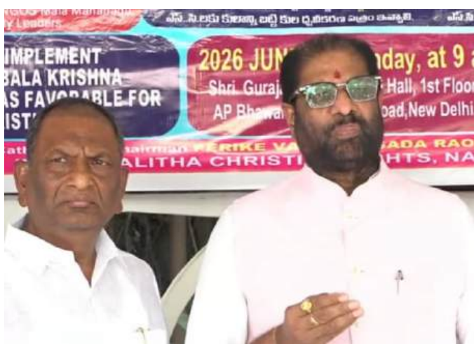
(మగతా 2వ పేజీలో)

హైదరాబాద్, జూన్ 10 (వాయిస్ టుడే): ఈ నెల 16న నిర్వహించనున్న మొహర్రం ఊరేగింపు కార్యక్రమాలకు ప్రభుత్వం అన్ని విధాలా ఏర్పాట్లు చేస్తోందని రాష్ట్ర రవాణా, బీసీ సంక్షేమ శాఖ మంత్రి పాన్సం ప్రభాకర్ తెలిపారు. మంగళవారం డా. బి.ఆర్. అంజెద్దూర్ తెలంగాణ రాష్ట్ర సచివాలయంలో మైనారిటీ సంక్షేమ శాఖ మంత్రి మహమ్మద్ అజారుద్దీన్, ప్రభుత్వ సలహాదారు మహమ్మద్ షబీర్ అలీతో కలిసి వివిధ శాఖల అధికారులు, ముస్లిం మత పెద్దలతో నిర్వహించిన