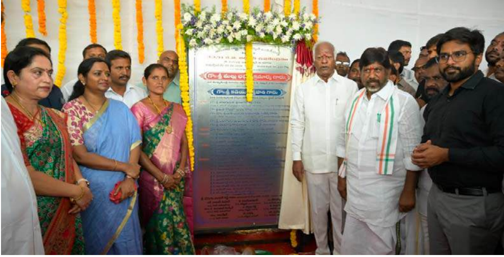
డిప్యూటీ సీఎం భట్టి విక్రమార్కు

స్టేషన్ ఘనపూర్లో పలు అభివృద్ధి కార్యక్రమాలలో పాల్గొన్న భట్టి