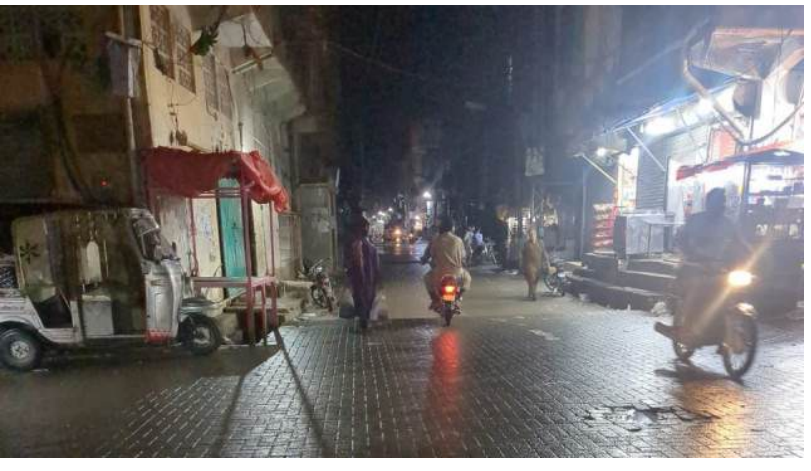
నైరుతి రుతుపవనాల ఆగమనానికి ముందే తెలంగాణలో వాతావరణం ఒక్కసారిగా మారిపోయింది. మంగళవారం సాయంత్రం హైదరాబాద్ వగరూని భారీ వర్షం ముంచెత్తగా, రాష్ట్రంలోని పలు జిల్లాలకు భారత వాతావరణ శాఖ 'ఎల్లో అలర్ట్' జారీ చేసింది. రానున్న

తెలంగాణకు రెండ్రోజుల పాటు ఎల్లో అలర్ట్ జారీ ఈడురుగాలులకు కూలిన చెట్లు, నిలిచిన విద్యుత్ సరఫరా ప్రజలు అప్రమత్తంగా ఉండాలని అధికారుల సూచన