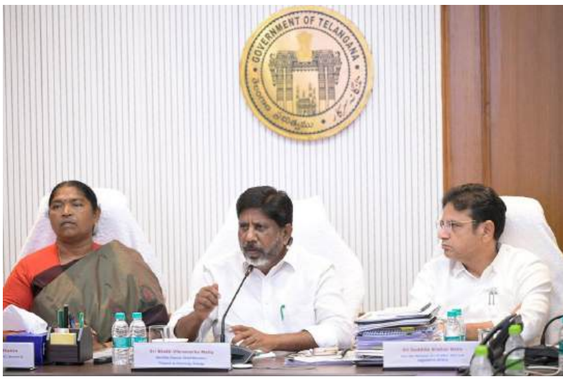
అందజేస్తున్నట్లు తెలిపారు. ఉద్యోగులు, వారి కుటుంబాలకు మెరుగైన వైద్య సేవలు అందించేందుకు ఏరియా ఆసుపత్రుల ఆధునికీకరణ, గోదాపరిఖనిలో క్యాన్సర్ ల్యాబ్ ఏర్పాటు వంటి చర్యలు చేపట్టామని చెప్పారు. వైద్య సేవల కోసం ఏటా రూ.300 కోట్లకు పైగా ఖర్చు చేస్తున్నట్లు వెల్లడించారు. సింగరేణి కార్మికుల సంక్షేమం, ఉద్యోగ భద్రత, వారి కుటుంబాల భవిష్యత్తు కోసం ప్రభుత్వం నిరంతరం కృషి చేస్తోందని భర్తీ విక్రమార్కు పేర్కొన్నారు. భవిష్యత్తులో కొత్త బోర్డు గనులు, కొత్త ప్రాజెక్టుల ద్వారా మరిన్ని ఉపాధి అవకాశాలు కల్పించేందుకు చర్యలు కొనసాగుతాయని తెలిపారు.

ప్రజా ప్రభుత్వం ఏర్పడిన తర్వాత సింగరేణిలో 2,657 పోస్టులను భర్తీ చేసినట్లు ఉప ముఖ్యమంత్రి తెలిపారు. వీటిలో 555 ప్రత్యక్ష నియామకాలు, 2,102 కారణ్య నియామకాలు ఉన్నాయని చెప్పారు. కారణ్య నియామకాల గరిష్ట పరిమితిని 35 సంవత్సరాల నుంచి 40 సంవత్సరాలకు పెంచడంతో ఇప్పటికే 200 మందికి పైగా లబ్ధి చేకూరిందన్నారు. దేశంలోనే తొలిసారిగా సింగరేణిలోని 40 వేల మంది ఉద్యోగులకు రూ.1.25 కోట్ల ప్రమాద బీమా సదుపాయం కల్పించినట్లు తెలిపారు. అదనంగా ఉద్యోగుల కోసం రూ.10 లక్షల ఉచిత సహజ బీమా, కాంట్రాక్టు కార్మికులకు రూ.40 లక్షల ప్రమాద బీమా సదుపాయాలు అమలు చేస్తున్నట్లు వెల్లడించారు. గత రెండేళ్లలో కార్మికులకు లాభాల వాటాగా రూ.1,500 కోట్లను చెల్లించినట్లు పేర్కొన్నారు. అలాగే కాంట్రాక్టు కార్మికులకు కూడా వరసగా బోనసులు